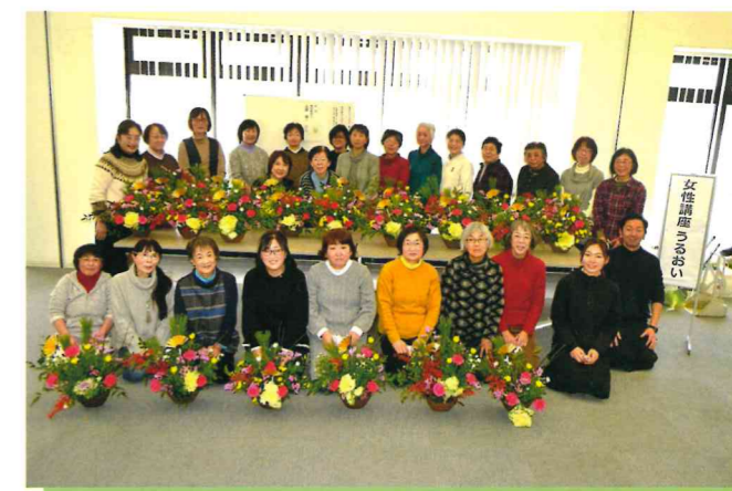
女性講座 うるおい