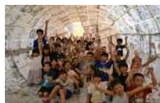
7/19 迫力満点！新聞ドームをつくるよ！