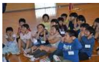
5/3 レクリエーションゲーム