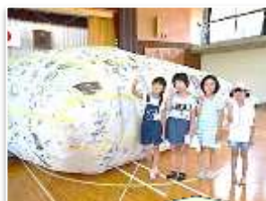
新聞ドームを作ろう！