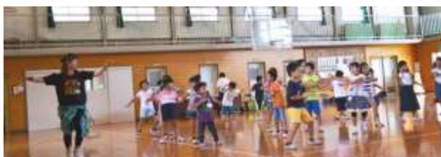
9/17 ズンバ&フィットネスボール