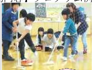
ニュースポーツに挑戦！！