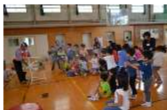
6/24 かがくのトビラを開こう！！