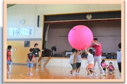
7/20 暑さに負けず、体を動かそう!! ニュースポーツ体験