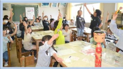
6/16 こけし作りに挑戦!! 世界にひとつだけのこけし