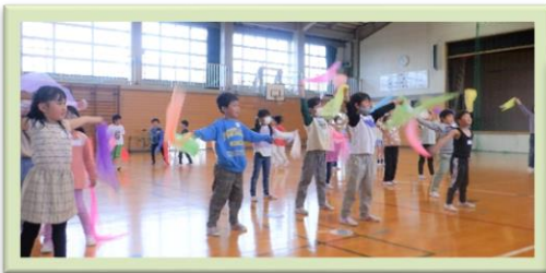
5/15レッツ！ミュージック♪2023