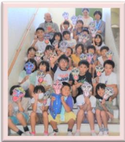
8/25 会津伝統凧～ミニ唐人凧づくり