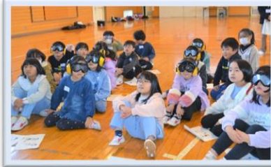
11/13 お年寄りの世界を のぞいてみよう