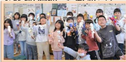
10/16 手作りハロウィンに挑戦しよう!!