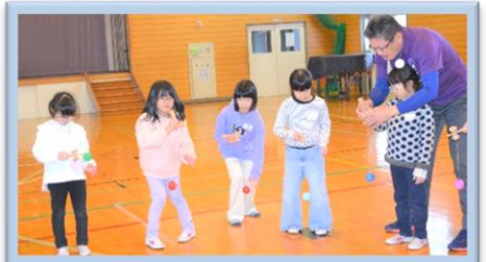
12/22 けん玉名人がやって来る!! けん玉に挑戦しよう!