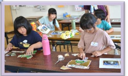
9/11 オリジナルパズルをつくろう