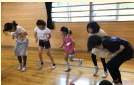
左右違う手と足に万歩計をつけて30秒間手と足を動かしました