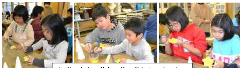
星型の台座に黄色の絵の具をぬりました。