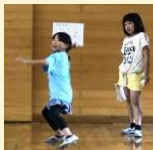
バドミントンのシャトルを力いっぱい投げました