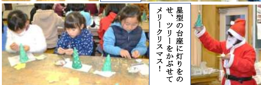
星型の台座に灯りをのせ、ツリーをかぶせてメリクリクリスマス！