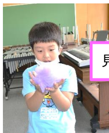
見て見て＊お花が咲いたよ＊