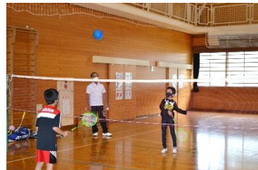
9/17 元気に体を動かそう!