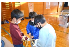
力強く！ワラをなうw

12月14日、1・2年生を対象に「しめ縄作り」を行いました。活動指導員の土屋さんにお話を聞きながら、3人一組でワラをない、一本のしめ縄が完成！3本できたところで、それぞれ飾りつけをしました。縁起ものである「松」や「南天」、花や折り紙などをグルーガンで付け、オリジナリティーあふれるしめ縄が完成しました。