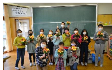
11/22 勤労感謝にお花を届けよう