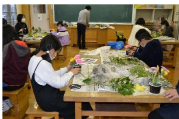
10/25 ハロウィンフラワーアレンジメント