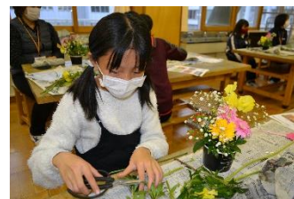
フラワーアレンジメント☆