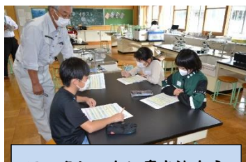
ワークシートに書き込もう

9月22日の放課後子ども教室では、福島県浄化槽協会さんを活動支援員にお迎えし4年生対象に「こども環境教室～水のゆくえ～」を行いました。どこからともなく登場した“ハカセ”がパワーポイントを使い浄化槽の役割や環境を守るお話してくれ、『水の汚れを調べる実験』『顕微鏡で微生物を観察☆』『トイレトペーパーとティッシュペーパーが水に溶ける時の違いの実験』をしました。ハカセの話しをととても真剣に聞きワークシートに書き込んだり、顕微鏡をのぞいた時には「すごい！いた～！！」「動いてる～！！」と驚きの声が聞かれました。最後に猪苗代湖の水をきれいにするために日々私たちがしなければならぬことを確認し、充実した教室となりました。