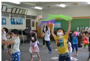
音楽に合わせて身体を動かそう♪