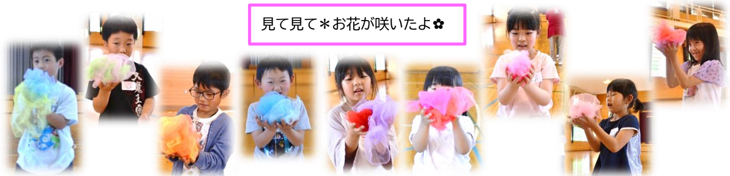
見て見て*お花が咲いたよ*