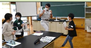
曲に合わせてノリノリ実験タイム