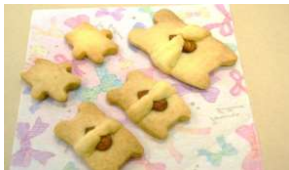
(アーモンドを抱いたクマのクッキー)

お問い合わせ：生涯学習課(学びいな内) 電話72-0180 FAX62-5350