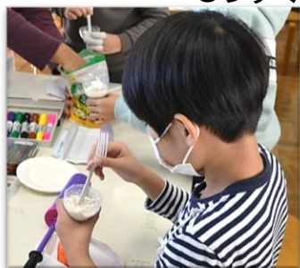
風船に小麦粉を入れて