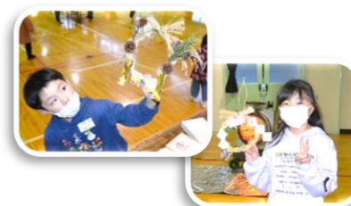
一生懸命作ったよ!