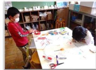
③ 糸を取り付けたビニールに絵を描いて