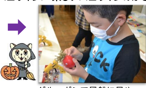
グルーガンで風船に目や毛糸の髪を付けて