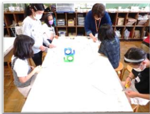
① ビニールをはさみで切って