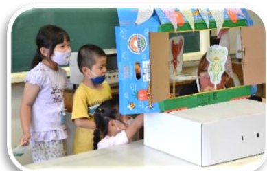
はじめまして!こんにちは♪