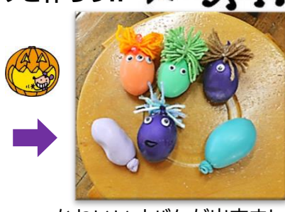
かわいいオバケが出来ました♪

ハロウィン🎃にちなみ、風船や毛糸、木の枝、紙皿を使ってかざり作りをしました。風船に小麦粉を入れたり、木の枝・紙皿でクモの巣を作ったり、毛糸で作ったポンポンや目、ビーズをつけたりと、それぞれステキなかざりができました。ぜひおうちでかざって下さいね。～😊ハッピー☆ハロウィン😊～