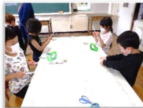
② ストローをテープで貼り付けて