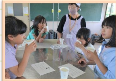
6/19 あまくておいしい飲みもののヒミツ スポーツドリンクを作ってみよう