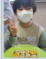
10/30 ハッピーハロウィンクッキング かわいいハロウィン白玉を作ろう！