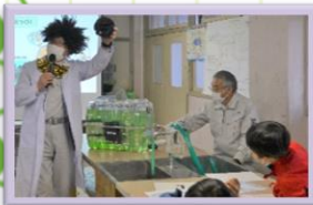
11/20 こども環境教室～水のゆくえ～