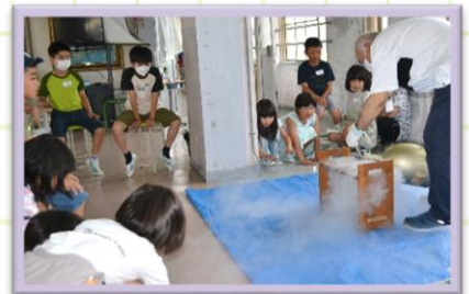
7/10 液体窒素で何でも凍る？ コチコチ実験