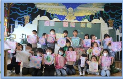
5/30 どんな色に染まるかな？わくわく！ ドキドキ！かんたん染め物に挑戦