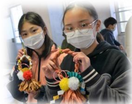
12月の活動のようす