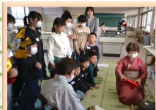
1/22 お茶をどうぞ～茶道体験～

2月19日（月）「翁島小学校ありがとう！思い出のコースターを作ろう！」を開催しました。色とりどりのきれいなタイルを並べて、張り付けてセメントをきれいに塗りました。世界に一つだけのステキな作品を残す事ができました。