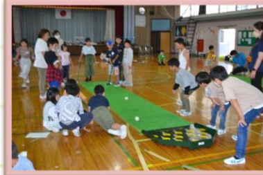
9/25 高齢者疑似体験と スカットボール