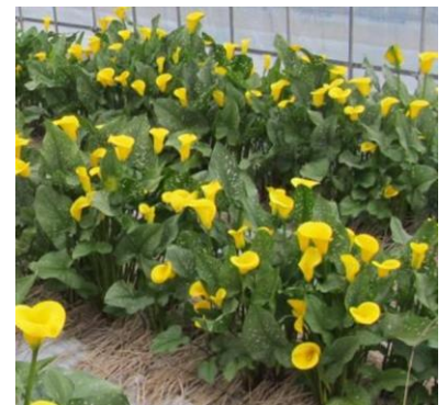
ゴールドクラウンの開花

（２）収穫後の球根の肥大率、球数も多く、レーマニー系は再利用球による栽培に適する系統と考えられます。