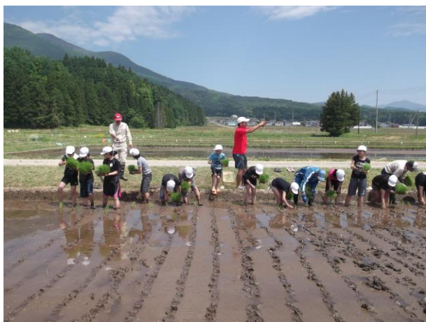
一列に並んでスタート

今回田植えをしたのはもち品種の「ヒメノモチ」です。秋に稲刈り体験を行い、収穫したお米をモチにさせていただく楽しみが待っています。