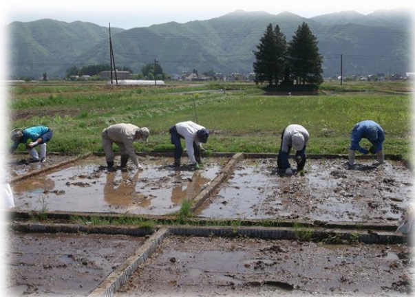
三要素試験の手植え