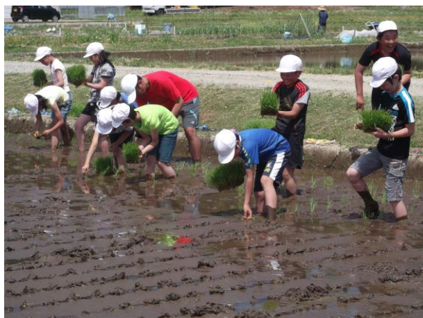
順調に田植えは進みます