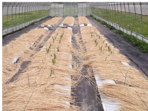
芽が出始めたカラー（６月２日）

県農業総合センター会津地域研究所が「アグリいな」でレーマニー系カラーの試験栽培を実施して３年目になります。今年はパイプハウスを一棟増設して、去年より多くの試験課題に取り組みます。５月８日にオランダ産キャプテンフエゴ（橙）、５月１９日にゴールデンクラウン（黄）とクリスタルスプラッシュ（白）、５月２６日に福島県育成の群系１号（白）の定植を行いました。