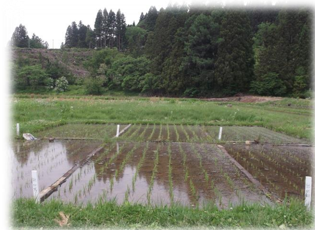
三要素試験のコンクリート枠圃場