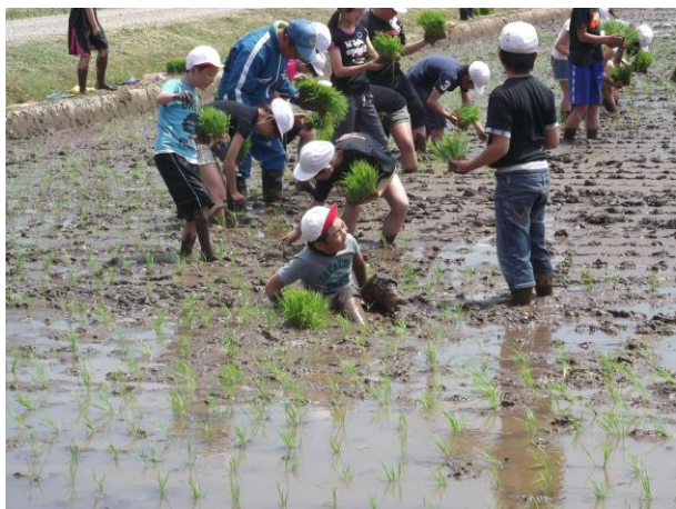
しりもちをつく子が続出