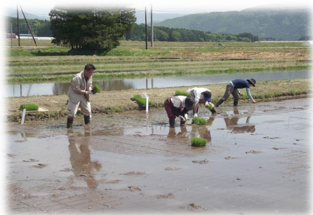
奨励品種決定調査の手植え

当日は天候に恵まれ、あたたかな陽気の中での田植えでした。その後も好天続きで、移植した稲は順調に生育しています。