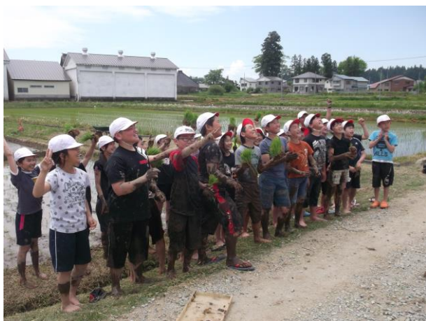
泥んこ大将はだれ？