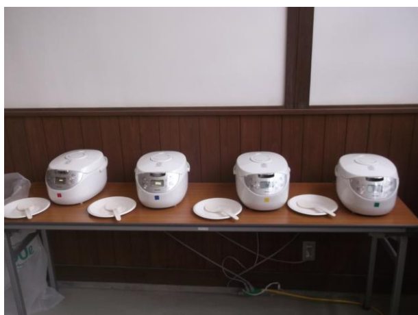
同じ型式の電気釜で炊飯

15人のパネラー（食味試験者）が同じ型式の電気釜で炊飯した4種類のご飯を食べ比べ、「外観」「味」「香り」「粘り」「硬さ」「総合」の6項目の評価を行いました。