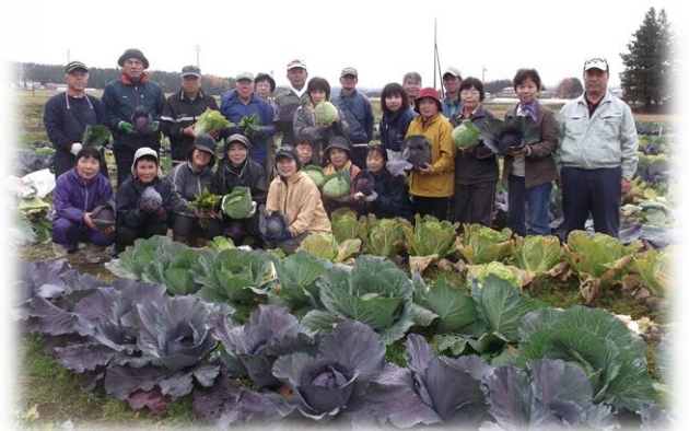
収穫物を手に記念撮影

野菜づくり講習会が終わってから収穫祭を行い、豚汁をいただきながら野菜づくりのことなどを話しあって、参加者同士の親睦を深めました。