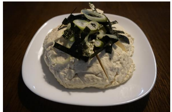
同じように作ったざる豆腐