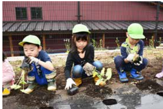
カボチャの苗を植える園児