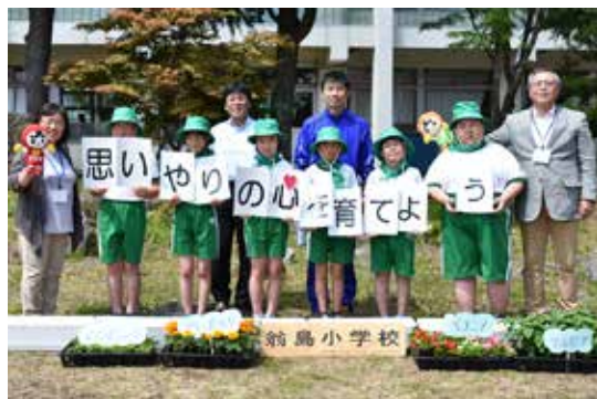
花の苗を受けた翁島小の児童ら