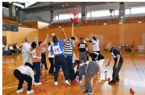
「玉入れ」で 100 個の玉を籠に投げ入れる参加者