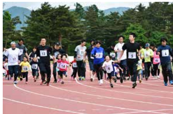
親子マラソンキッズの部で元気よくスタートする参加者