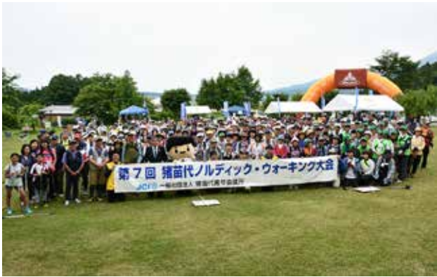
過去最多となる約 350 人が参加