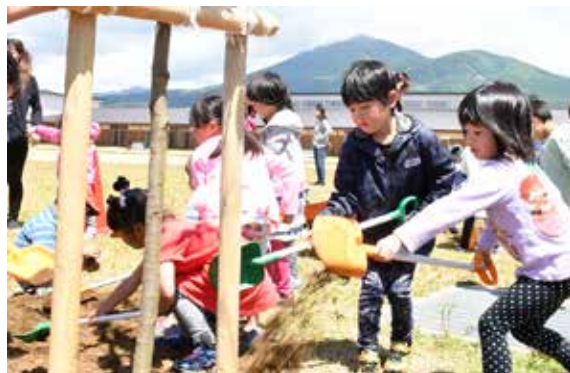
ソメイヨシノの若木を植える卒園児たち

卒園児らは、園庭の東側に高さ約 3 ㍎のソメイヨシノの若木 3 本を丁寧に植えました。