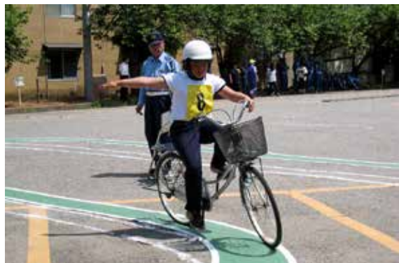
真剣な表情で実技テストに臨む児童

交通安全子供自転車会津方部大会は 6 月 15 日、会津若松市の鶴ヶ城体育館と子供自転車安全運転コースで開かれ、喜多方、猪苗代、磐梯の 1 市 2 町から 5 小学校、7 チームが参加しました。競技は学科テストと実技テストの総得点で争われ、実技テストでは、選手たちが S 字走行やジグザグ走行などで日ごろの練習の成果を披露しました。採点の結果、団体の部は磐梯一小が優勝。成績上位の磐梯一、長瀬、猪苗代の各チームが県大会に出場します。