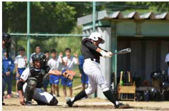
全会津大会への出場切符を懸けて熱戦を繰り広げる選手