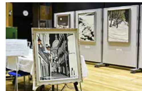
20点の作品が展示された切り絵展