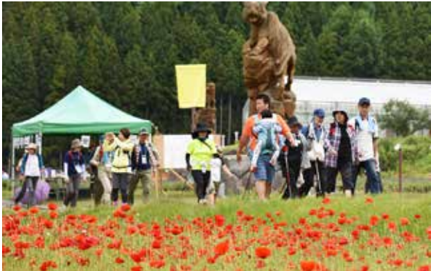
猪苗代ハーブ園のポピーを眺めながら歩く参加者