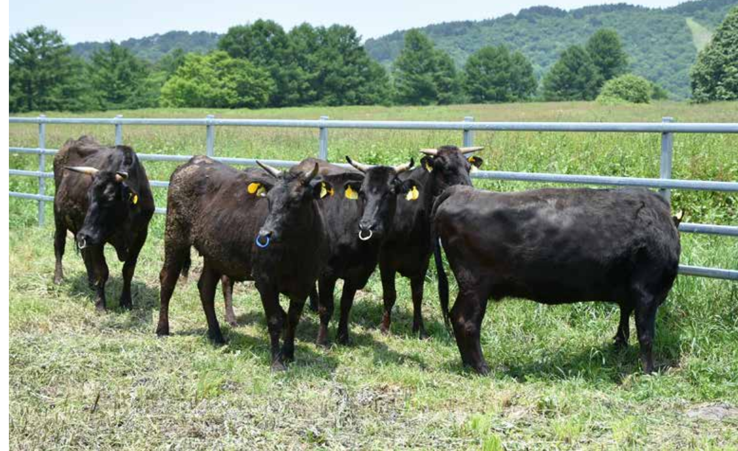
6 年ぶりに牛が放牧された町営磐梯山牧場