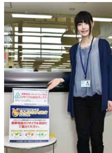
役場内に設置された回収ボックス

2020年に開催される東京オリンピック・パラリンピック競技大会の入賞メダルに、不要になった携帯電話などに含まれるリサイクル材が活用されることになりました。