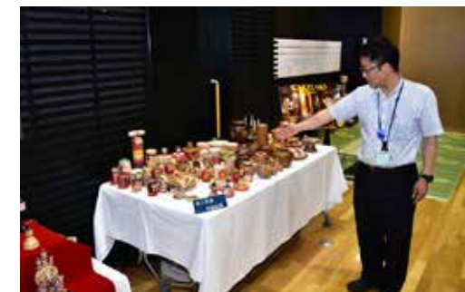
中ノ沢系木地玩具など約150点が展示された

夏休み企画展「みちのくの 木地玩具展」は7月25日から 8月6日まで、和みいにて開 かれました。