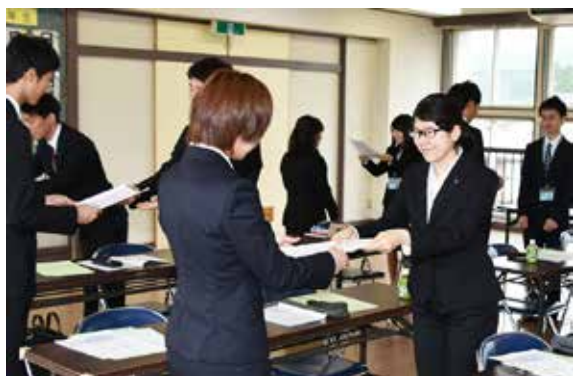
ビジネスマナーを学ぶ新社会人