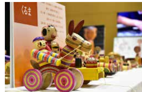
「くるま」を題材とした木地玩具