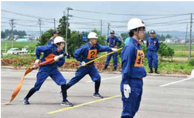
小型ポンプ操法の部優勝の第3分団の操法