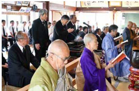
磐梯山噴火による犠牲者の冥福を祈る関係者ら