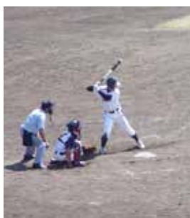
頑張れ！猪苗代町チーム