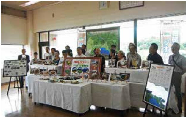
「磐梯山ジオカレー」をお披露目する関係者ら