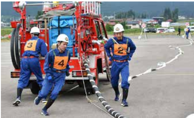
ポンプ車操法の部で優勝した第6分団の操法