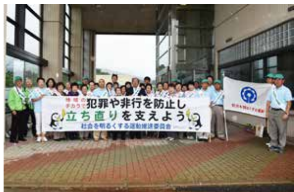
7月18日の広報活動出発式に参加した皆さん

「社会を明るくする運動」強化月間の7月、町内では猪苗代地区の保護司会や更生保護女性会などの関係団体により、犯罪のない明るい社会を築くための活動が繰り広げられました。7月3日早朝にはJR猪苗代駅前で行き啓発活動を行い、参加した約40人がチラシなどの啓発グッズを配り、非行防止などを呼びかけました。18日には町内広報活動として広報車で呼びかけを行ったほか、事業所などへ訪問し、明るい社会づくりへの協力を求めました。