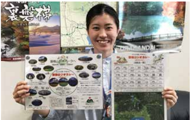
磐梯山ジオパークを紹介するランチョンマット