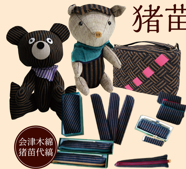
会津木綿 猪苗代縞

猪苗代縞は会津木綿の地縞の一つとして古くから使われておりました。1985年頃に猪苗代町内の織り手がいなくなり途絶えていましたが、道の駅猪苗代の開業に向けて復活。道の駅猪苗代限定の猪苗代縞のデディベアやカバン、小物などを販売しています。