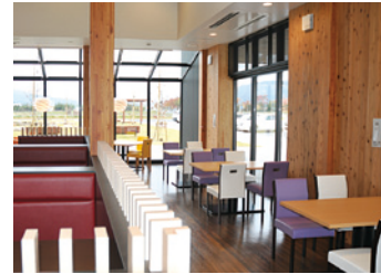
ダイニング I (アイ)