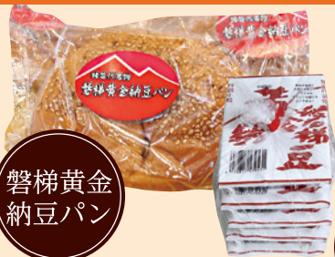
磐梯黄金 納豆パン

猪苗代名物「黄金納豆」をほんのり甘いパンで包み、軽く揚げました。一度食べたらずけになる味わいです!