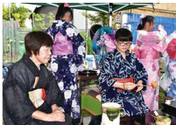
磐梯まつりでお茶を振る舞う茶道同好会の生徒ら