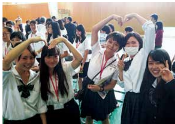
台湾の高校生との交流会（5月29日）