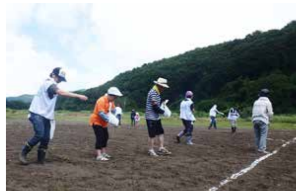
丁寧にソバの種をまく参加者

参加者は、直径約 50 ㌢のスマイルマークをかたどって白線を引いた後、ソバの種を丁寧にまきました。