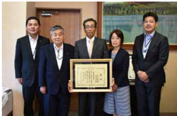
受賞を報告する義明さん(中央)と福子さん(右隣)