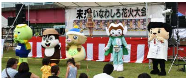
ご当地キャラによるステージパフォーマンス

花火打ち上げ前には「それいけ！アンパンマンショー」やひでよくんらによるご当地キャラステージが繰り広げられ、訪れた家族連れなどが多彩なステージイベントを楽しみました。