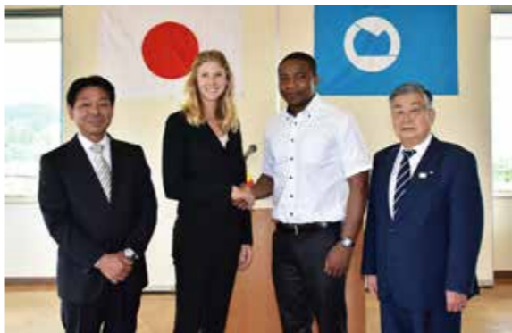
セイラムさんと握手を交わすジェシカさん(左から2人目)