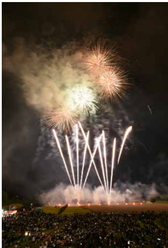
猪苗代の夏の夜空を彩る花火