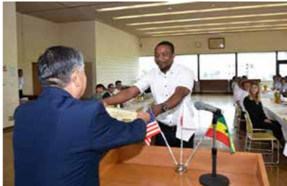
前後町長から感謝状を受けるセイラムさん