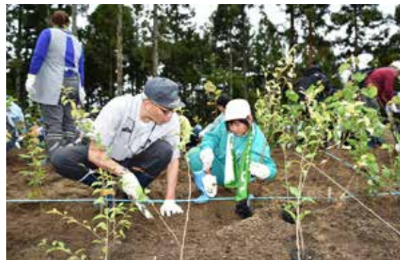
苗木を丁寧に植樹する参加者

「新しい鉄道林中山宿6号鉄道林」植樹式は9月23日、田子沼地区の中山宿6号鉄道林で行われ、県内外から約800人が参加しました。開会式では、東日本旅客鉄道仙台支社の坂井究支社長が「鉄道林には、吹雪や雪崩などからお客様を守る働きがあります。定期的に植え替えを行い、鉄道の安全を図りたいです」とあいさつを述べました。参加者は、ケヤキやナナカマドなど14種類の苗木約7000本を丁寧に植えました。