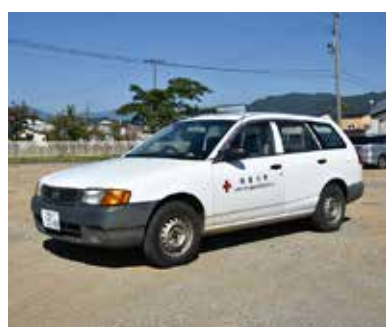
マツダファミリアバン

・平成11年式 ・走行距離 127654 キロメートル (平成29年9月21日現在) ・仕様 ガソリン車