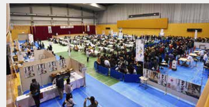
県内最大級！本格手打ちそば！

今年も新そばの収穫を祝い、新そば祭りを開催します。 猪苗代新そば祭りは、猪苗代産の新そば「いなわしろ天の香」を「ひきたて、うちたて、ゆでたて」で皆さまに召し上がっていただくお祭りです。