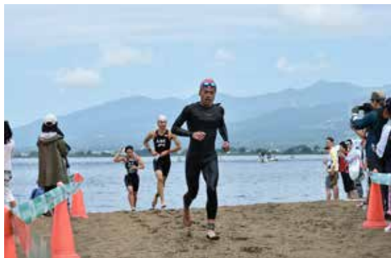
体力の限界に挑戦する選手

「第19回うつくしまトライアスロン in あいづ」は8月27日、猪苗代湖天神浜をスタートし、会津若松市の会津大学でフィニッシュするコースで開かれ、県内外から過去最多となる540人が参加しました。参加した選手は、スイム1.5 キロ 、バイク40 キロ 、ラン10 キロ の計51.5 キロ のコースで体力の限界に挑戦。過酷な鉄人レースに臨む選手たちに、応援に駆けつけた観戦者からは盛んな声援が送られました。