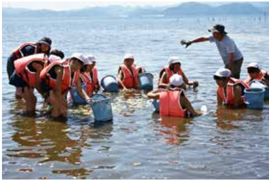
アサザの苗を移植する児童ら