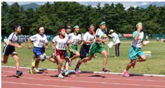
6年女子800㍍決勝に臨む児童