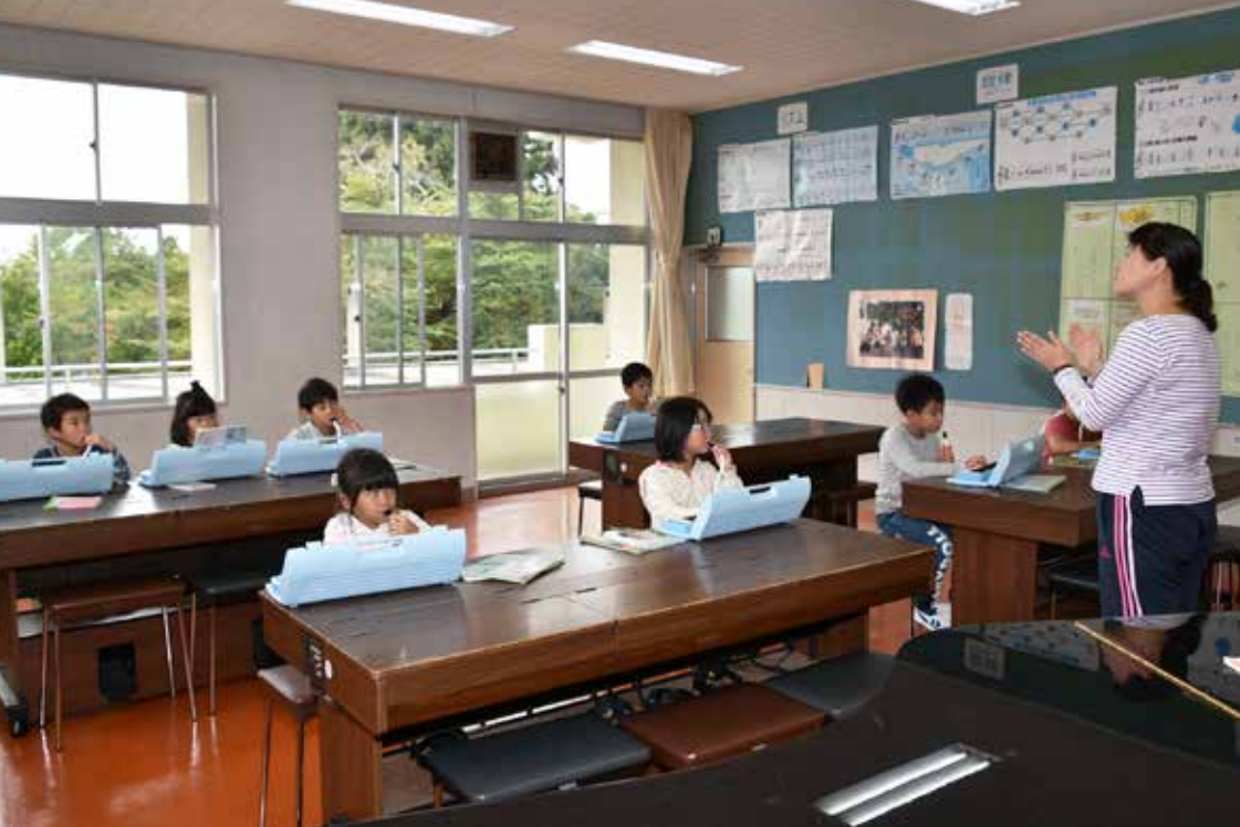
図教育委員会 教育総務課 ☎(62)5677