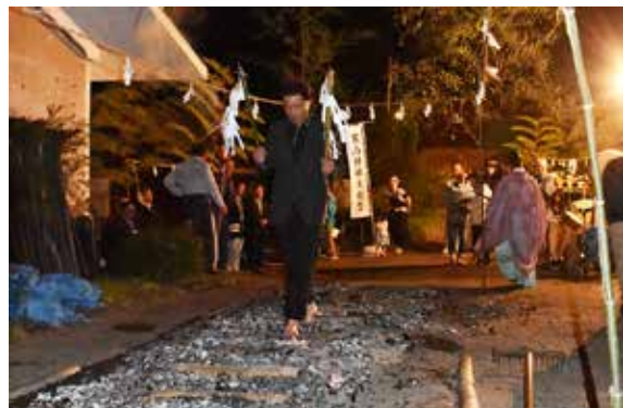
伝統行事の火渡りに臨む住民ら

祭りでは神事を執り行った後、地区住民らが地域の安全などを祈りながら、伝統行事の火渡りに臨みました。また、会場では餅の振る舞いが行われました。