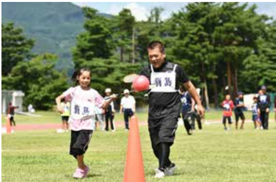
区長と小学生が息を合わせる「はさんでラケット便」