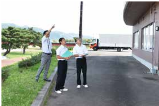
町水防センターを見学する生徒ら

吾妻中学校3年生16人は9月14、15の両日、総合学習の一環として、町水防センターやひまわりこども園などの施設で課題追求体験学習を行いました。生徒たちは6班に分かれ、「町内の子どもと保育施設」や「猪苗代湖の水環境はどうなっているのか」など、班ごとに設定した課題追求テーマについて学習しました。生徒たちは後日、研究内容をそれぞれ取りまとめ、11月4日に同校で開かれる文化祭で発表を行う予定です。