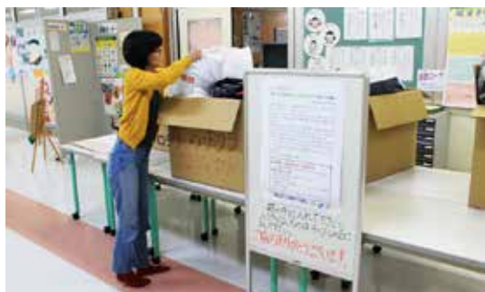
着なくなった服の回収に協力する保護者