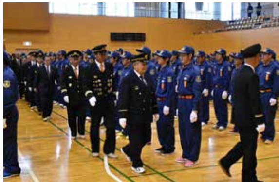
検閲官らの通常点検を受ける団員