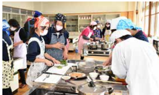
講師の指導を受けながら調理する児童