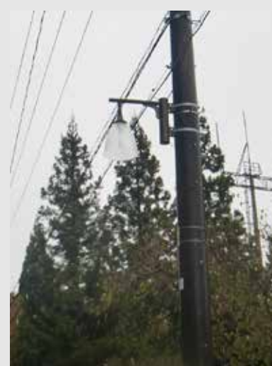
▲整備された防犯灯

このたび、一般財団法人自治総合センターの宝くじ社会貢献広報事業である、コミュニティ助成事業により、酸川野区にLED防犯灯20基が整備されました。