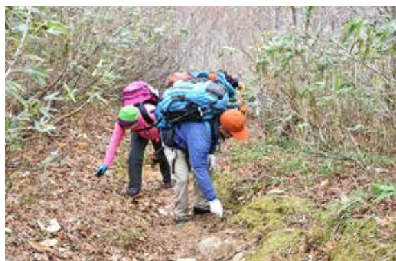
登山道のゴミを拾い集める猪苗代山岳会の会員ら