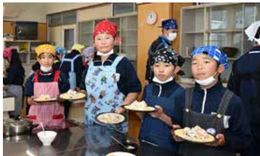
完成した「磐梯山デコレーションすし」