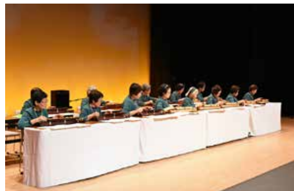
日頃の練習の成果を披露する大正琴琴伝流会の皆さん

第9回学びいな秋祭りは11月4、5の両日、学びいनाで開かれました。ステージでは、町体験交流協会に所属する団体が歌や舞踊、楽器演奏など、日頃の練習の成果を披露しました。会場内には、学びいなが主催する各種講座参加者や高齢者によるさまざまな作品が展示され、来場者の目を楽しませました。また、屋外テントコーナーでは、焼きそばや焼き鳥などの出店が立ち並び、多くの来場者でにぎわいました。