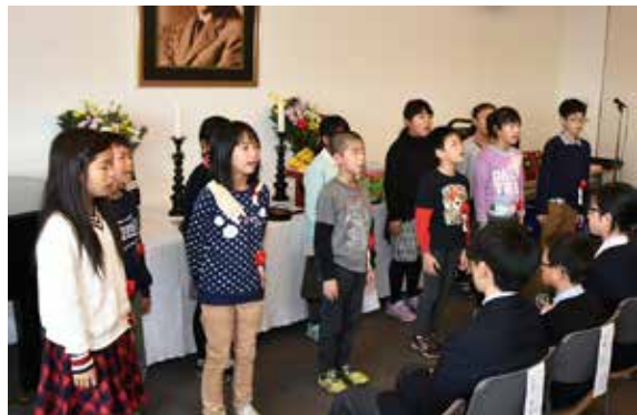
「野口英世の歌」を合唱する翁島小4年生の児童