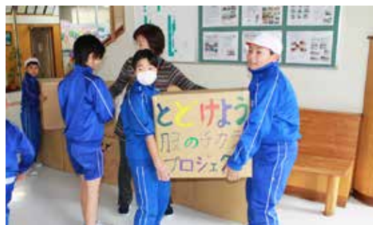
服の発送作業を行う児童ら