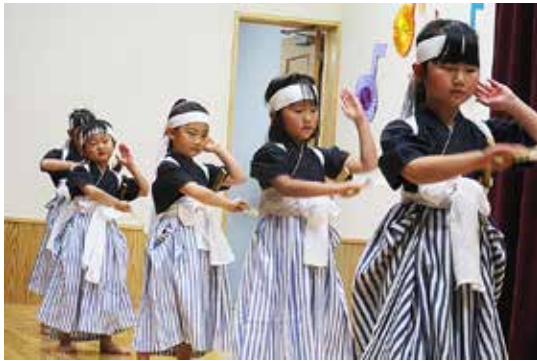
ひまわりこども園保育発表会