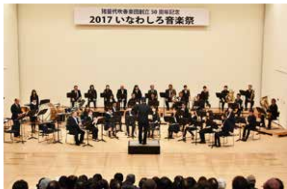
見事な演奏を披露する猪苗代吹奏楽団メンバーら

猪苗代吹奏楽団創立 50 周年記念 2017 いなわしろ音楽祭は 12 月 9 日、学びいなかで開かれました。音楽祭には猪苗代吹奏楽団のほか、福島県ばんだい荘あおば和太鼓の会や猪苗代高校吹奏楽部などが参加し、見事な演奏を披露しました。猪苗代中学校 3 年 3 組の生徒は「Together」、「心の瞳」の 2 曲を合唱。また、千里小 1 年生児童が白虎隊の剣舞を披露するなど、盛りだくさんの発表が行われました。