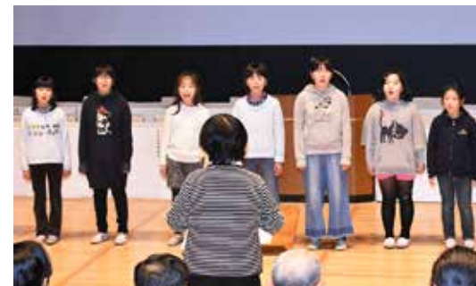
息の合った歌声を披露する猪苗代小合唱部の児童