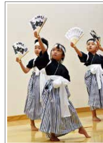
【撮影日】11月25日 【場所】さくらこども園

さくらこども園の保育発表会は11月25日、同園で開かれました。年長・さくら組の子どもたちは白虎隊の剣舞を披露。会場からは大きな拍手が送られました。(関連9ページ)