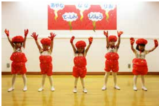
中の沢保育所保育発表会

さくらこども園保育発表会は11月25日、ひまわりこども園と中の沢保育所保育発表会は12月2日に開かれ、子どもたちが歌やダンスなど日ごろの練習の成果を披露しました。一生懸命に取り組む子どもたちの姿に、各会場を訪れた保護者からは大きな拍手が送られました。