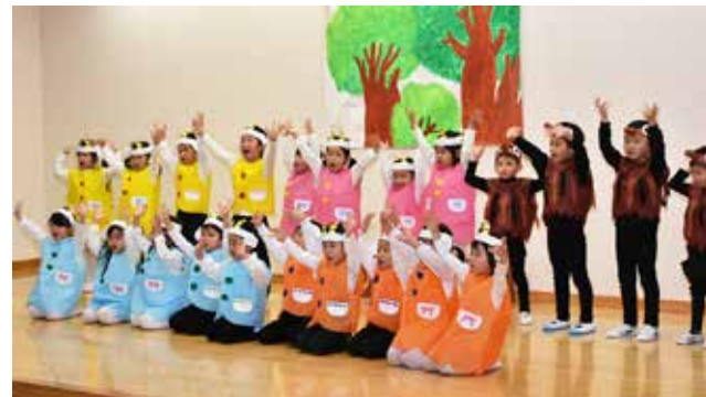
さくらこども園保育発表会