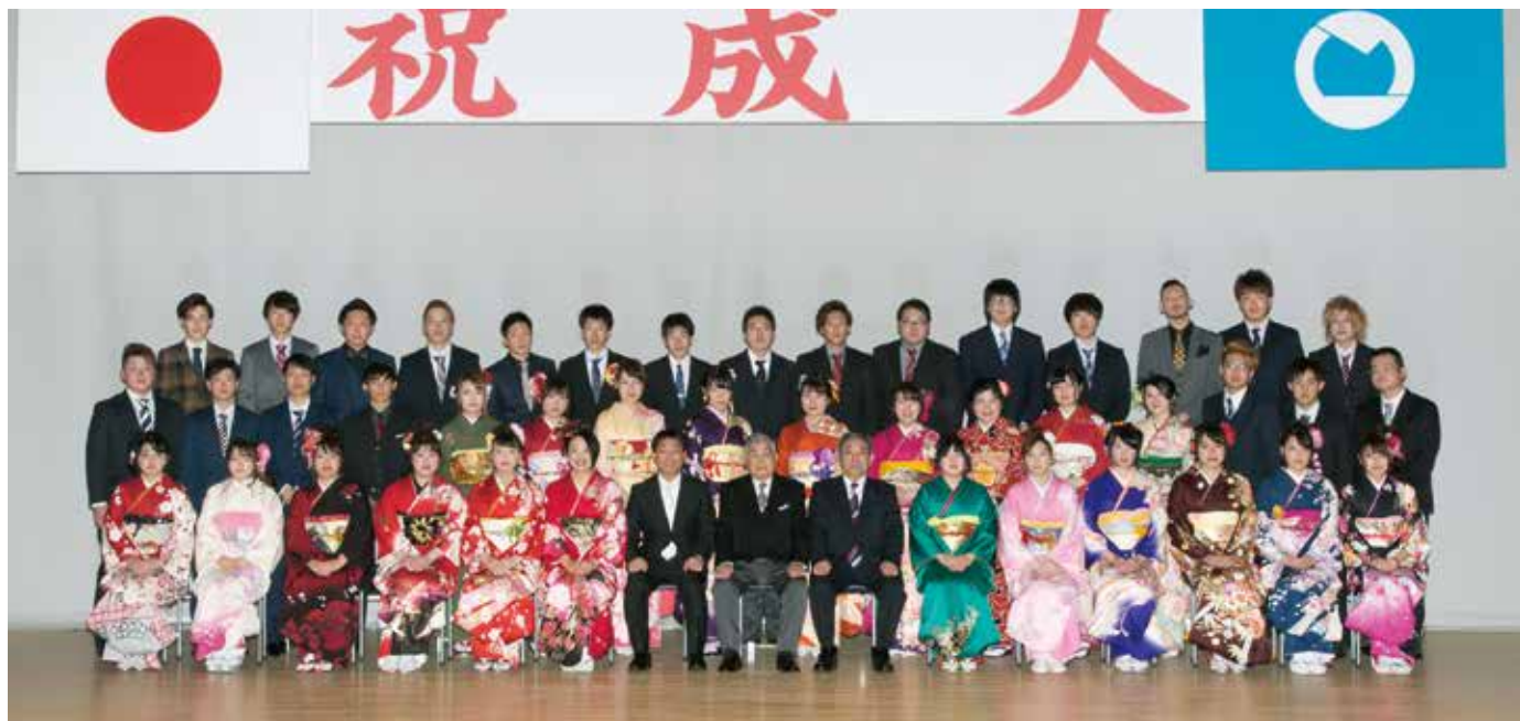
月輪・長瀬・吾妻地区の新成人