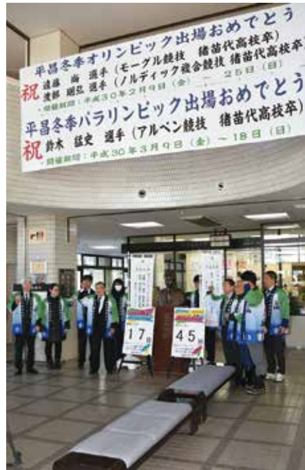
1月23日、町ゆかりの3選手の活躍を願い、役場玄関ホールには横断幕と開幕までのカウントダウンボードが設置された。