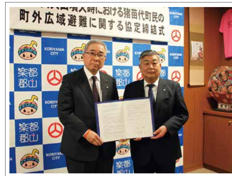
品川萬里郡山市長と広域避難に関する協定を締結する前後公町長(12月21日)