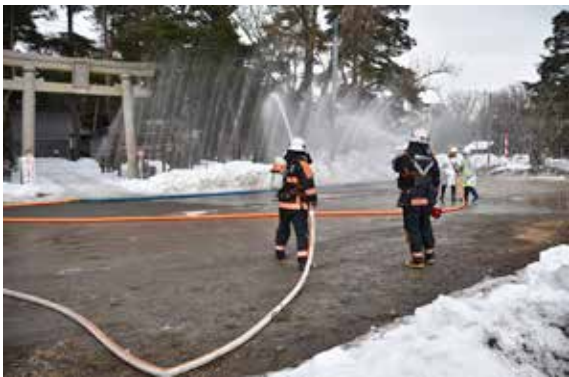
小平瀨天満宮で放水訓練を行う参加者