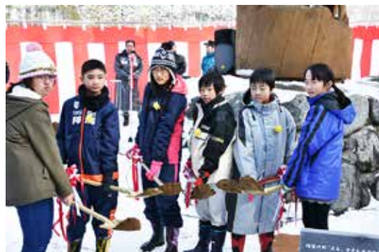
宝箱の鍵が入ったカプセルを埋設する児童