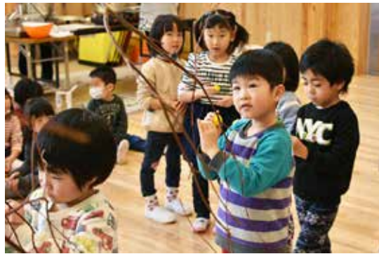
ミズキの木に団子を飾る園児