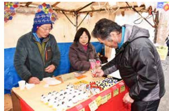
起き上がり小法師などの縁起物を買求める来場者

会場となった通りには、起き上がり小法師やだるまなどの縁起物や飲食物の露店が並び、大勢の買い物客でにぎわいました。