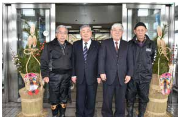
左から小檜山さん、前後町長、増子理事長、佐藤さん