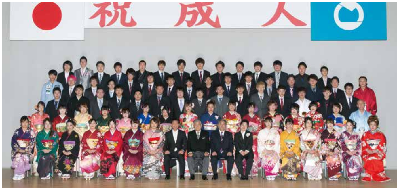
猪苗代・翁島・千里地区の新成人