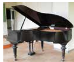
グランドピアノ 型番：No.20