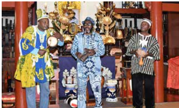
ガーナの民族音楽「ティガリ」を披露するアクアバのメンバー