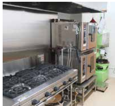
▲道の駅猪苗代の加工室