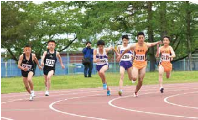
共通男子4×100mリレー決勝