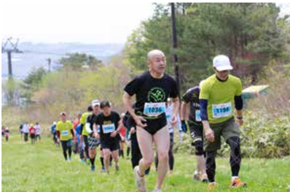
リゾートスキー場のゲレンデを駆け上がる参加者