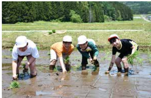
田植えに挑戦する千里小5年生の児童