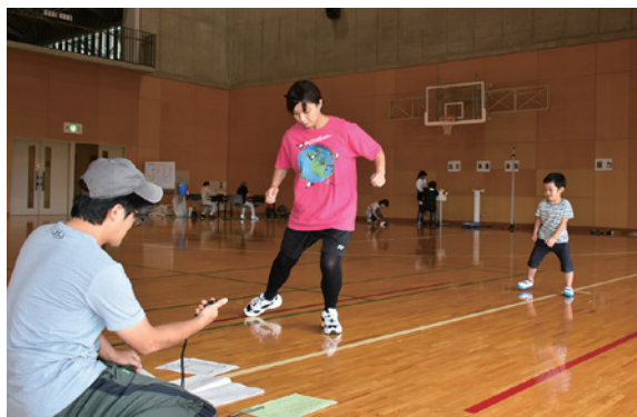
体力測定を行う参加者