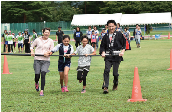
小・中学生と一般と一緒に走る「台風の日」