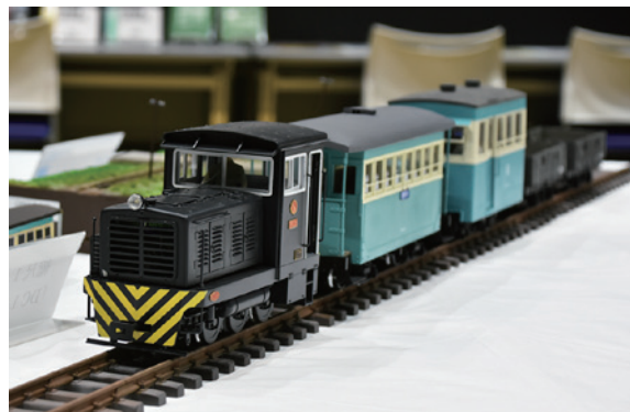
沼尻軽便鉄道のディーゼル機関車の模型

会場には、沼尻軽便鉄道のディーゼル機関車や当時の町並みを再現した模型が設置されたほか、軽便鉄道の写真パネル 34 点が展示されました。