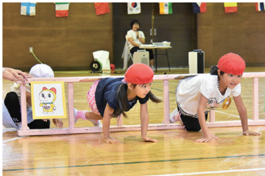
「ドラえもののヒミツ道具」で競い合う子どもたち

平成30年度中の沢保育所の運動会は9月15日、中ノ沢体育館で開かれました。当日はあいにくの雨天となり、体育館での開催となりましたが、子どもたちは日ごろの練習の成果を元気に披露しました。全児童によるかけっこや、たんぼぼ、もも組による「おつかいアリさん」、さくら組による「ドラえもののヒミツ道具」など14の演技が行われ、元気に演技する子どもたちの姿に会場を訪れた保護者からは盛んな声援が送られました。