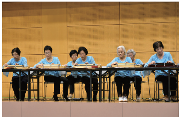
大正琴の演奏を披露する町婦人連絡協議会の皆さん