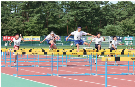
6年男子 80㍍ハードル決勝