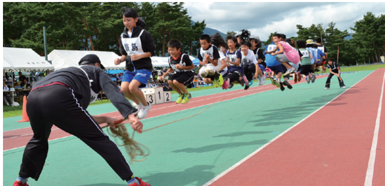
息を合わせて「みんなでジャンプ」

第 37 回町民大運動会は 9 月 2 日、町運動公園陸上競技場で開かれ、町内 6 地区から参加した約 1200 人が爽やかな汗を流しました。今年も 2020 年東京五輪・パラリンピックのホストタウン事業の一環として、北京五輪陸上 400㍍リレー銀メダリストの高平慎士さんがゲスト参加。子どもたちを対象とした陸上教室や地区対抗リレーを通じて町民と交流を深めました。地区別の成績では、翁島地区が総合優勝、千里地区が準優勝に輝きました。