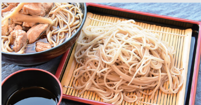
県内最大級！本格手打ちそば！

今年も新そばの収穫を祝い、新そば祭りを開催します。 猪苗代新そば祭りは、猪苗代産の新そば「いなわしろ天の香」を「ひきたて、うちたて、ゆでたて」で皆さまに召し上がっていただくお祭りです。地元産の新鮮な秋野菜の販売も行いますので、ぜひご来場下さい。