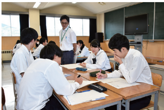
「自分たちにできる保全活動は何か」を話し合う生徒