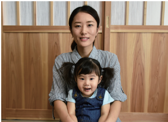
大好きなママと一緒に「ハイ、チーズ」

「絢」は綺麗な人になるように。川の道しるべという意味がある「滞」は人生に迷わないように。絢滞ちゃんの名前には、そんなパパとママの願いが込められています。