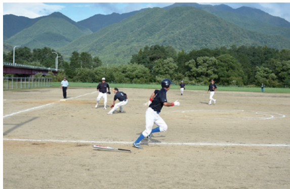
ソフトボールで熱戦を繰り広げる選手