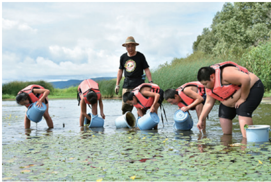
アサザの苗を移植する児童ら