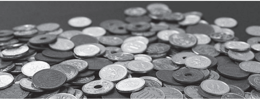
平成29年度歳入歳出決算額および対前年度比較表