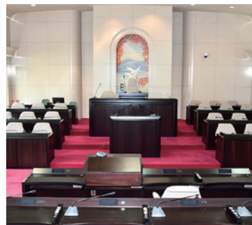
猪苗代町議場（町役場 3 階）