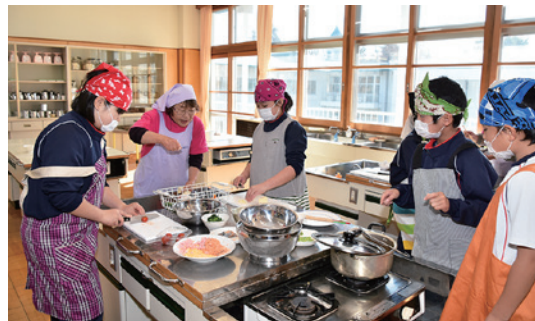
講師の指導を受けて真剣な表情で調理する児童