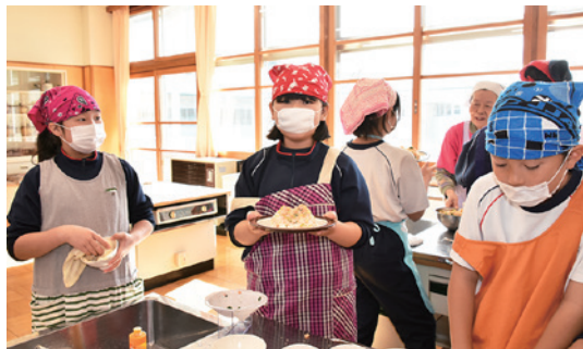
おいしそうな磐梯山デコレーションすしが出来ました