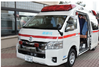
▲更新された救急車

猪苗代消防署では救急車の更新を行い、最新式の機材を搭載した高規格救急車を導入しました。