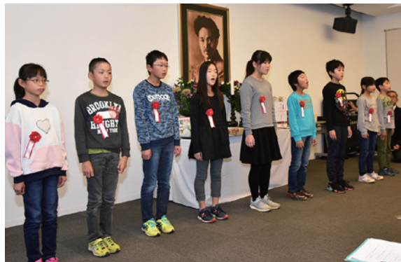
「野口英世の歌」を合唱する翁島小 4 年生の児童

世界的な医学者、野口英世博士の第 142 回誕生祭は 11 月 9 日、野口英世至誠館で行われました。野口家の菩提寺である長照寺の楠俊道住職による読経の後、関係者らが献花をしました。また、翁島小学校 4 年生の児童が唱歌「野口英世の歌」を披露しました。野口英世記念会の八子弥寿男理事長が「今後も野口博士の遺訓を後世に伝えていきたい」とあいさつ。大川原久夫副町長らが祝辞を述べました。