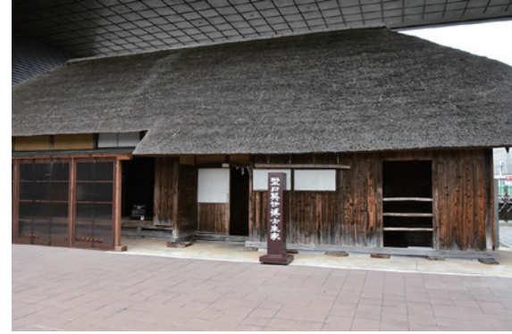
国登録有形文化財の答申を受けた野口英世生家主屋