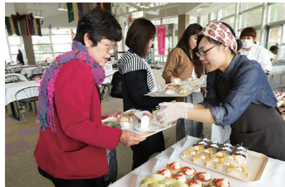
さまざまなスイーツが用意されたイベント会場

第 6 回猪苗代スイーツフェスタは 11 月 17 日、猪苗代スキー場ミネロセンターハウスで開かれ、町内外から訪れた約 250 人が本町のスイーツを味わいました。イベントには町内の 9 店舗が参加。和菓子や洋菓子などさまざまなスイーツが用意され、来場者は各店舗から一つずつ、合計 9 種類のスイーツを味わいました。会場内では、あめ細工の実演やお菓子作り体験などが行われたほか、バイオリンとピアノの演奏が披露されました。