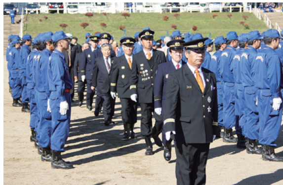
検閲官らの通常点検を受ける団員