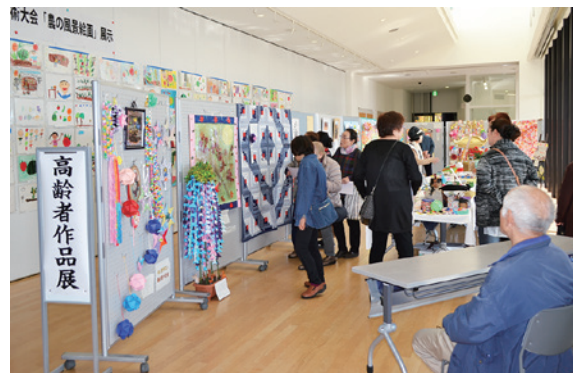
さまざまな作品が展示された学びいな館内

第 10 回学びいな秋祭りは 11 月 4、5 の両日、学びいなで開かれました。ホールでは、町体験交流協会に所属する団体がステージに立ち、歌や舞踊、楽器演奏など、日頃の練習の成果を披露しました。学びいな館内では、各種講座の参加者や高齢者によるさまざまな作品が展示され、来場者の目を楽しませました。また、屋外テントコーナーでは、焼きそばや焼き鳥などの出店が立ち並び、家族連れなど多くの来場者でにぎわいました。