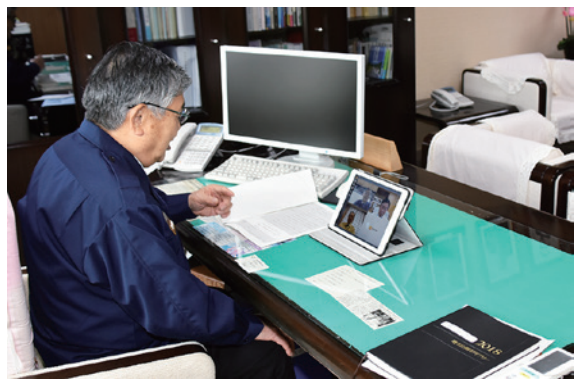
ウェブ会議システムを使い対応を協議する前後公町長

猪苗代、磐梯、北塩原の 3 町村でつくる磐梯山火山防災連絡会の情報受伝達訓練は 11 月 6 日、各町村役場で行われました。訓練は、磐梯山で火山性微動などが発生し、仙台管区気象台から噴火警報が発表され、噴火警戒レベルが 2 に引き上げられることを想定して実施されました。連絡を受けた各町村長は、ウェブ会議システムを使用して登山道の閉鎖や登山者・観光客などの安全確保、正確な情報発信の方法などを協議しました。