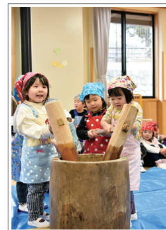
【撮影日】12月6日 【場所】さくらこども園

さくらこども園では12月6日、同園で恒例行事の「餅つき」を行いました。さくら組、うめ組、もも組の園児たちが大きなきねと臼を使って、上手に餅をつきました。