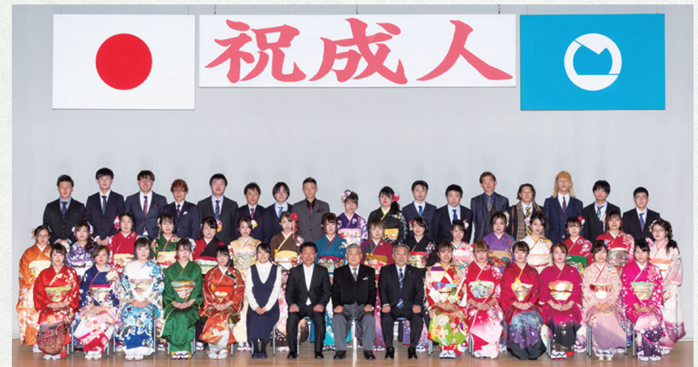
月輪・長瀬・吾妻地区の新成人