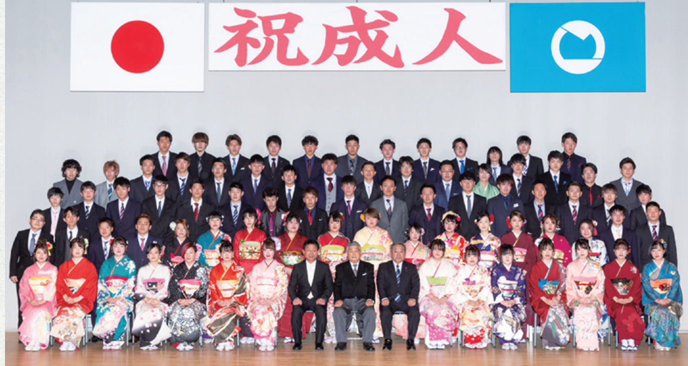
猪苗代・翁島・千里地区の新成人