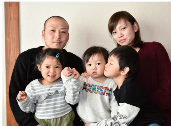
仲良し家族でハイ、ポーズ