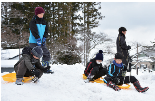
翁島小の校庭でそり遊びを楽しむ児童