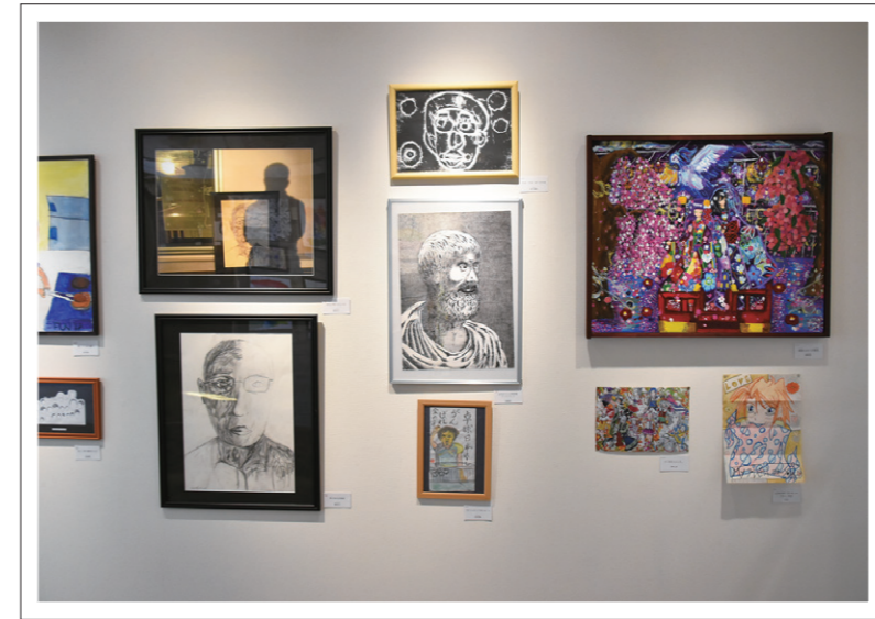
さまざまな作品が展示された芸術作品展