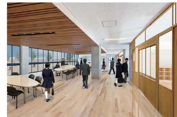
▲統合中学校内観イメージ

新しく生まれ変わる中学校にふさわしい、生徒や町民の皆さんに末永く愛され、親しんでもらえる校名をぜひ応募ください。