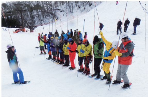
遭難者の捜索訓練を行う参加者