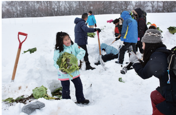
雪下キャベツの収穫体験を行う参加者