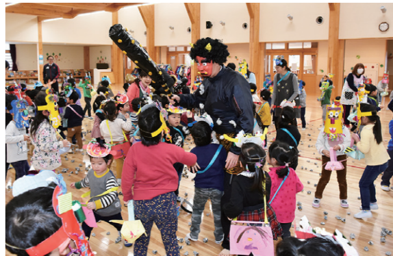
元気に豆まきするひまわりこども園の子どもたち

突然園内に太鼓の音色が鳴り響くと、鬼に扮した職員が登場。子どもたちは「鬼は外、福は内」と元気な声を上げながら古新聞で作った豆を投げ、悪い鬼を追い払いました。