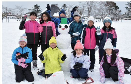
協力して雪だるまを完成させた両校の児童