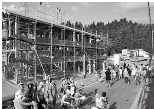
久しぶりの建前に、参加した皆さんの興奮も最高潮

町が建設を進めている町営住宅鶴峰団地の上棟式は9月10日、現地で開催され、関係者らが建設中や竣工後の建物の無事を祈りました。式典終了後には1～4号棟の各棟でもちや大根などがまかれ、建前を楽しみに訪れた皆さんが、笑顔でもちを拾いました。