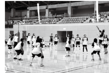
写真は、山潟・田子沼対樋ノ口の対戦。惜敗した樋ノ口チームでは「あのセッターにやられた」という話が打ち上げまで続いたそうです。

町民球技大会の中央大会は9月11日、町運動公園とカメリーナで開催されました。ソフトボール、バレーボールの白熱した好ゲームの様子を写真で紹介しします。成績は学びの泉をご覧ください。