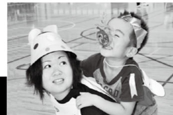
写真上 おじいちゃん、おばあちゃんと協力して頑張る、千里幼稚園の「あくしゅでこんにちは！」 写真下 猪苗代保育所の親子競走「白馬に乗った王子様、お姫様」