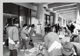
昨年の出店者の様子(屋内、屋外ブース)