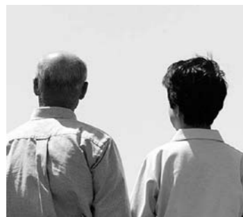
認知症は誰にでも起こる可能性の ある病気です

誰にでも起こる病気 それが認知症です 皆さんの周りに、認知症の人 はいますか。認知症は誰にでも 起こる可能性のある病気です。 現在、85歳以上の4人に1人は 認知症高齢者と言われており、 その数は年々増え続けています。 認知症は、脳や体の病気で脳の 神経細胞が損傷を受けたこと により、記憶力や判断力などが 低下して、日常生活に支障をき たしてしまう病気です。 しかし、認知症になっても感 情や自尊心などの心は残ってお り、ケアや対応の仕方では症状が 変わってくると言われています。