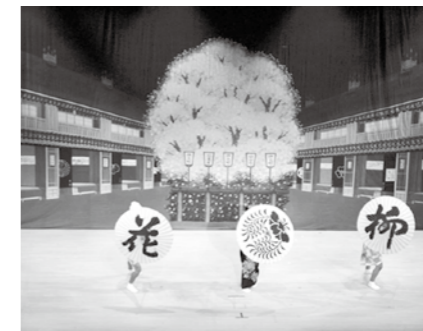
花柳流みほ乃会、神聖流聖涼支部などによるチャリティー舞踊会の一幕

学びいな秋まつりでは、協会加盟団体の発表もあります。皆さんぜひ足を運んでください。