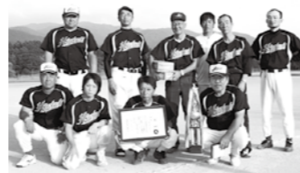
ソフトボール優勝の樋ノ口チーム