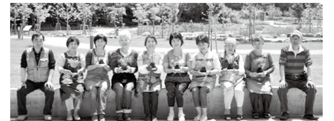
春の受講生の皆さんと講師のお二人。完成した作品を手に笑顔。