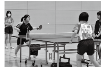
写真上 東中学校で開かれたバレーボール競技には、全4校が参加。写真は猪中と吾妻中の対戦 写真下 カメリーナでも全4校が参加して卓球競技を開催。写真は吾妻中と磐梯中の対戦