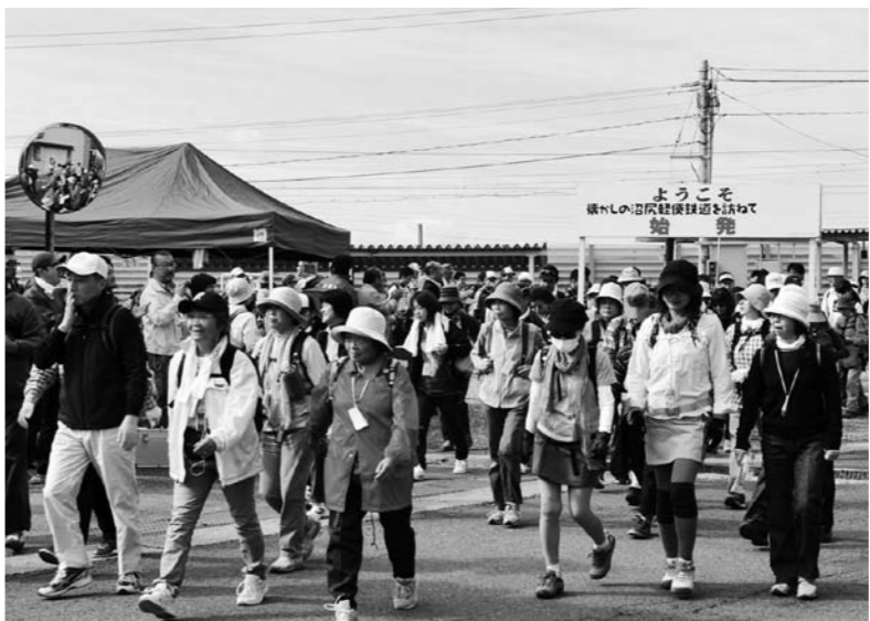
出発進行の掛け声とともに川桁駅を出発した参加者

昭和の大ヒット歌謡曲「高原列車は行く」のモデルとして知られ、1969（昭和44年）年に廃止された沼尻軽便鉄道。その鉄道跡を歩く「第13回懐かしの沼尻軽便鉄道を訪ねて」ウォーキングイベントは10月1、2日の両日、旧路線跡などで開催された。参加者は秋風を頬に受けながら思い思いのペースで歩き、心地よい汗を流した。町商工会青年部などで作る実行委員会が主催したこのイベントには、約180人が参加。2日には川桁駅から中ノ沢温泉までの約18 km の旧路線跡を歩いた。全11箇所の駅跡では、スタッフ