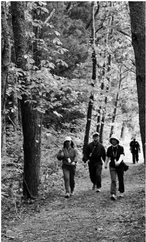
木地小屋～沼尻間にある森のトンネル

今大会は、風評被害の影響や放射線量など、いろいろなことを検討して開催にこぎつけた。参加者は約180人と、例年と比べて少ないが、2日間を通して参加する人の数は目標数を上回るなど、ある程度達成できた目標もあった。現在、猪苗代や福島県は、原発事故の被害の中にあり、少し元気を失っているように感じる。こんな時だからこそ、イベントを開催できるくらいの放射線量であることや猪苗代は元気であることなどをしっかりとPRしていきたい。お客さんと話をして、直接メッセージを伝えられるような、お客さんが触れ合いを感じられるような、そんなイベントにしていきたい。