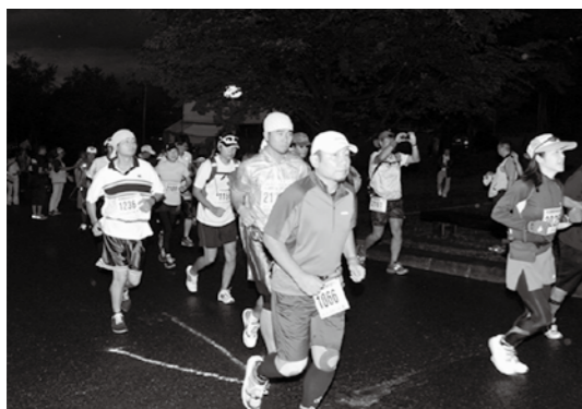
早朝5時、100キロ、65キロコースのスタート

第6回磐梯高原猪苗代湖マラソン(磐梯高原ウルトラマラソン)は9月3日、町内のホテルリステル猪苗代をスタート・ゴールとし、猪苗代湖周辺を走る3コースで開催されました。