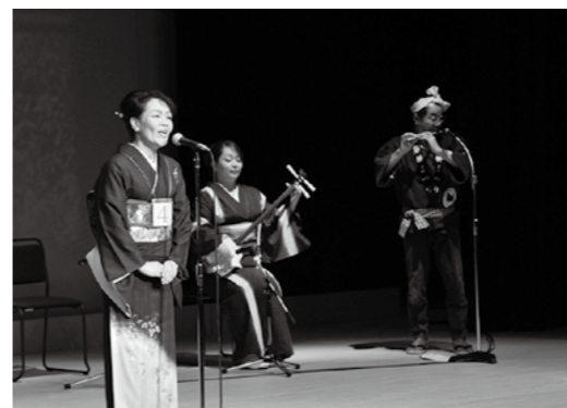
日ごろの練習の成果を発揮し、熱唱する参加者

福島県を代表する民謡として、全国の人に親しまれている会津磐梯山の全国大会は9月11日、学びいなかで開かれました。