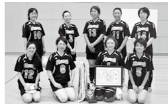
バレーボール優勝の川桁チーム