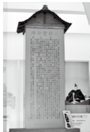
写真は、会場内にある「土津霊神の碑」の模型

また、福島県立博物館では11月27日(日)まで「保科正之の時代展」を、鶴ヶ城天守閣では10月25日(火)まで「会津藩の祖・保科正之展」を開催しています。