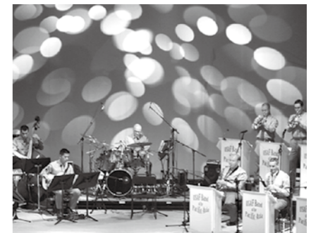
本場のジャズで観客を魅了したアメリカ空軍音楽隊