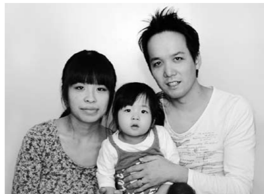
大好きなパパとママと一緒に「ハイ、チーズ！」

との適切な接し方についての講 演会を開催します。講演会の後 には、みちのくボンガーズが認 知症をテーマにしたオリジナル コントを上演します。この講演 会で認知症についての理解を深 めてください。 参加費は無料、申し込みも不 要です。ご家族・ご近所お誘い 合わせの上、ぜひ参加してくだ さい。 認知症講演会 「ぼけ」でも心は生きている ▼日時 10月20日(木) 午後1時30分 ▼場所 学びいな ▼問い合わせ先 保健福祉課 高齢者福祉業務 ☎(62) 2115 地域包括支援センター ☎(72) 1530 予防接種実施医療機関の変更 について 町で契約した「ヒブ」および 「肺炎球菌」ワクチン接種医療 機関の中で、接種を取り止めた 医療機関をお知らせします。 ※10月1日から接種取りやめ 医療法人敬天会小川医院