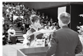
20歳の門出を古里で迎えよう

町内に住民登録をしていない場合は、往復ハガキの案内は送りません。出席を希望する人だけ、学びいなに申し込んでください。家族などが代理で申し込む場合は、新成人の氏名、生年月日、連絡先(電話番号など)を申し出てください。