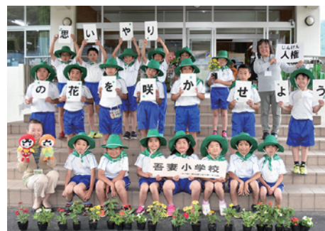
花の苗の贈呈を受けた吾妻小4、5年生の児童ら