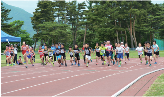
小学4年生男子・女子の部