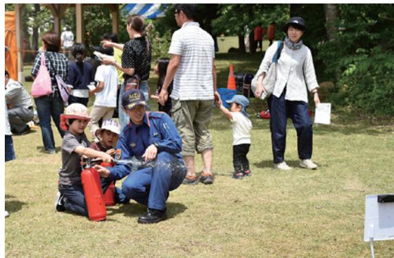
猪苗代消防署の消火体験に挑戦する来場者