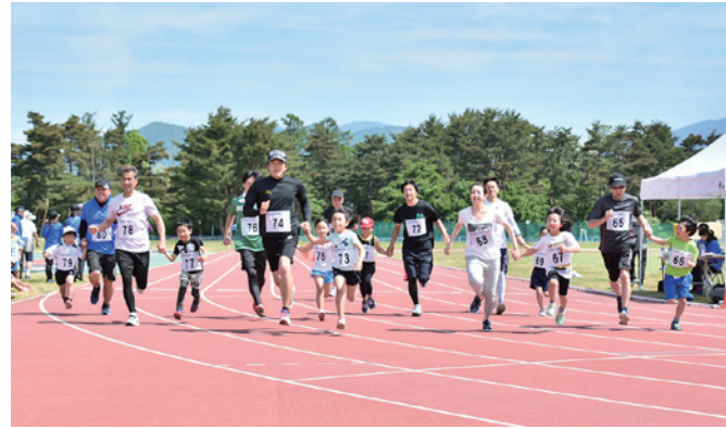
親子競争小学生の部（1・2年生）

スポーツに親しみ、健康と体力増進を図る「町民健康マラソン大会」は6月2日、町運動公園で開かれ、312人が出場しました。レースは男女別、年齢別などの25部門で争われ、参加した選手たちが爽やかな汗を流しました。当日は好天に恵まれ、ゴール目指して一生懸命に走る選手の姿に沿道からは盛んな声援が送られました。また、会場では町食生活改善推進員の皆さんによる豚汁の振る舞いが行われました。