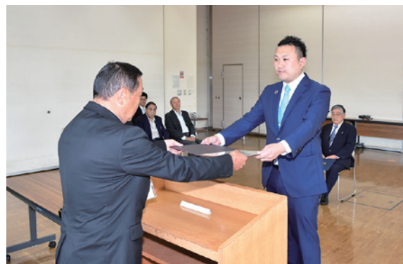
当選証書を受ける渡部氏(右)