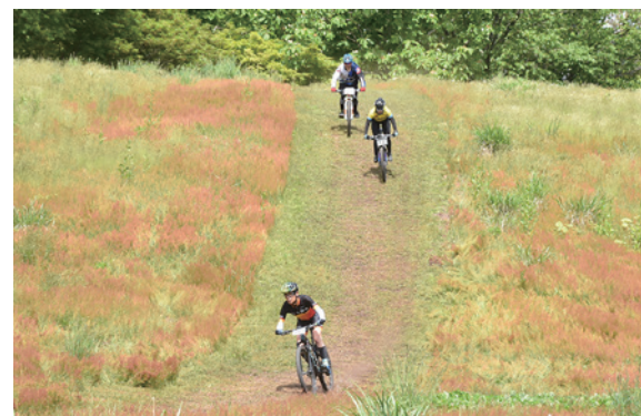
自然に囲まれたコースを駆け抜ける参加者

マウンテンバイクの3時間耐久レース「第7回ジンドュランス IN 猪苗代」は6月2日、磐梯南ヶ丘牧場で開かれました。ジンドュランス実行委員会が主催し、約120人が参加しました。レースは、男女別のソロや3人までのチーム、男女混合のミックス、ファミリーなど6クラスで行われ、1周約3キロの周回コースを3時間の制限時間内に周回した回数とタイムで争われました。参加者は、自然に囲まれたコースで己の限界に挑戦しました。