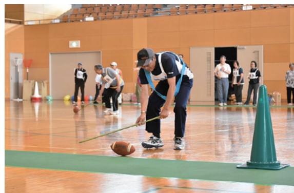
「ブタ追い競争」でラグビーボールを転がす参加者

町高齢者スポーツ大会は6月21日、カメリーナで開かれ、町内6地区から135人が参加しました。紅組(川西地区)、白組(川東地区)に分かれて競う「玉入れ」や、ラグビーボールを棒で転がして進む「ブタ追い競争」、男女ペアで肩を組み、顔と顔でボールを挟んでゴールを目指す「君といつまでも」など8種目で争われました。参加者は、心地よい汗を流しながら、スポーツを通じて健康増進を図りました。