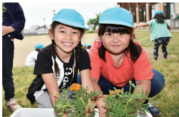
プランターに花の苗を植える園児

町では毎年、町内の観光施設や公共施設の緑化とイメージアップを図るため「花いっぱい運動」を実施しています。花の苗の配布は6月7日に行われ、マリーゴールドやサルビアなど6種類の花の苗約7千本が町内の観光関係団体や公共施設などに配布されました。このうち、さくらこども園では同日、さくら組の園児らが配布された花の苗をプランターに植える作業を行いました。園児たちは「大きくなあれ」と花の苗に声を掛けていました。