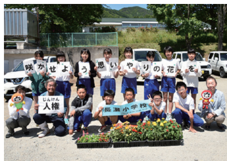
贈呈式に出席した長瀬小6年生の児童ら