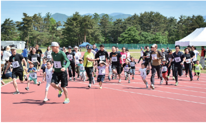
親子競争キッズの部