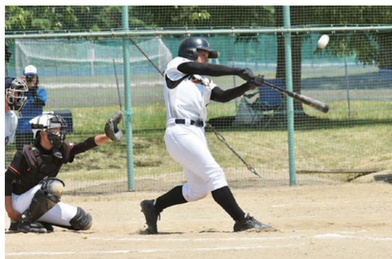
熱戦を繰り広げる選手

このうち軟式野球競技は楽天イーグルス猪苗代球場で行われ、猪苗代中と東中が対戦。試合は最終回の7回裏に猪苗代中が逆転し、5対4で勝利しました。