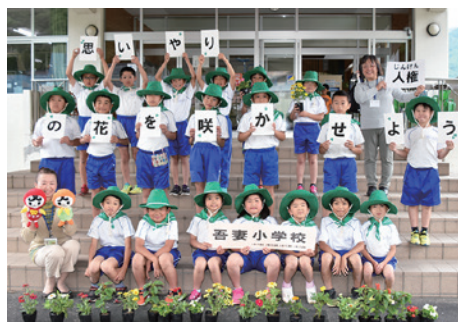
花の苗の贈呈を受けた吾妻小4、5年生の児童ら