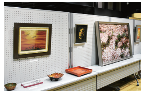
漆を使ったさまざまな作品が展示された