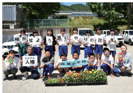
贈呈式に出席した長瀬小6年生の児童ら