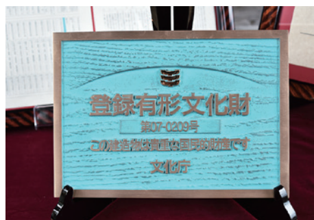
野口英世生家主屋の登録プレート