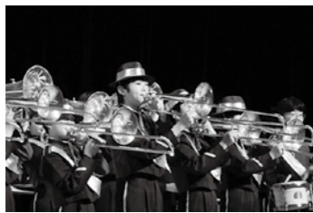
写真上 「いつも何度でも」 「ルパン三世のテーマ」で息 のあった演奏を披露した猪苗 代小学校 写真下 マーチングバンドと して東北大会出場も果たした 長瀬小学校