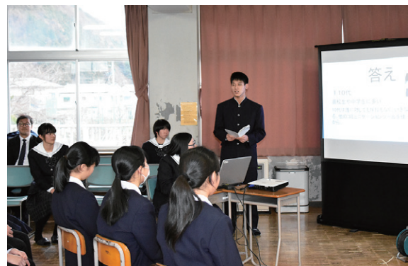
吾妻中で S N S の正しい使い方を紹介する猪苗代高の生徒