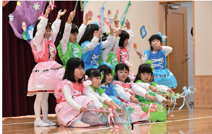
1_ ひまわりこども園・ちゅーりっぷ2組女子(年中)による「チャンス!」。カラフルな衣装で元気にダンスを踊った 2_ ひまわりこども園・ちゅーりっぷ3組園児による「おおかみと7匹のこやぎ」 3_ さくらこども園・りす組(1歳児)のリズム「果物カーニバル」 4_ 白虎隊の剣舞を披露するさくらこども園・さくら組(年長)の園児。会場からは大きな拍手が送られた。