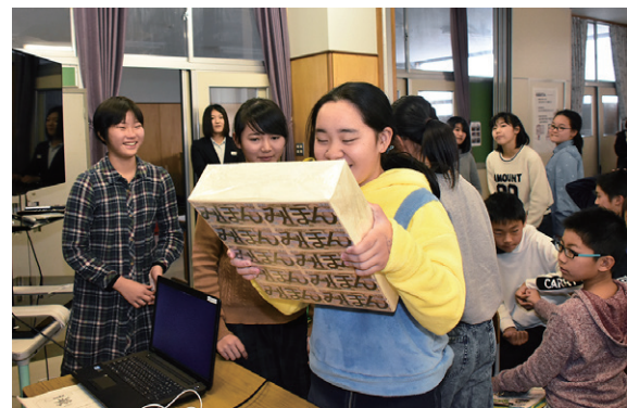
レプリカの 1 億円の重さを確かめる児童

猪苗代小学校租税教室は 12 月 4 日、同校で開かれ、6 年生の児童 42 人が税の仕組みなどについて理解を深めました。租税教室では町税務課職員が講師となり、DVD の映像や税に関するクイズを通じて税の大切さや使いみちなどについて説明しました。まとめの時間では、児童は「税の仕組みや税金が何に使われているか知ることができました」、「税金は無くても良いと思っていましたが、税金の大切さが分かりました」などと感想を話しました。