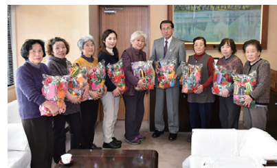
善意を寄せた猪苗代町生活学校の皆さん

○アクリルたわし 猪苗代町生活学校の皆さんは 11 月 27 日、町に手作りのアクリルたわし 300 個を寄贈しました。