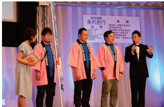
公開収録に臨む渥美部長(右から2人目)ら