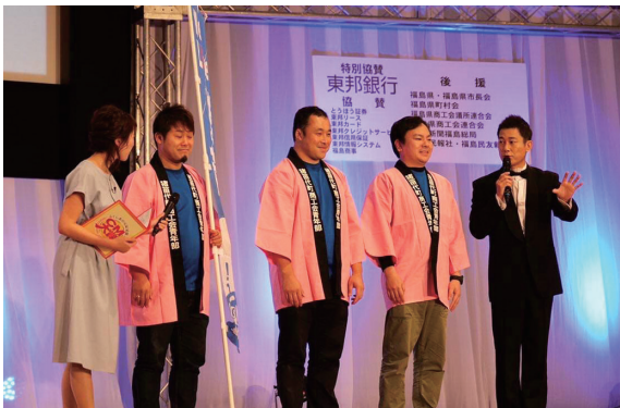
公開収録に臨む渥美部長(右から2人目)ら