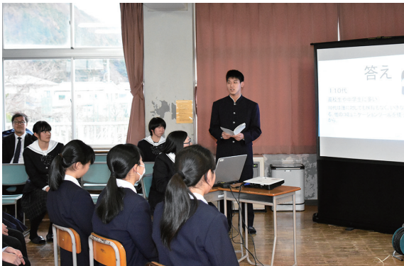
吾妻中で S N S の正しい使い方を紹介する猪苗代高の生徒

猪苗代高校では、11 月から 12 月にかけて、中学生を対象とした会員制交流サイト(S N S)の出前講座を開きました。12 月 3 日には、吾妻中学校で出前講座を行い、猪苗代高校生徒会の生徒 7 人が劇やクイズなどを通じて S N S の怖さや正しい使い方を紹介。S N S 上のやりとりで不登校になったり、個人情報が出た事例などを伝えました。中学生からは「自分で注意してトラブルにならないようにしたい」などの意見が出されました。