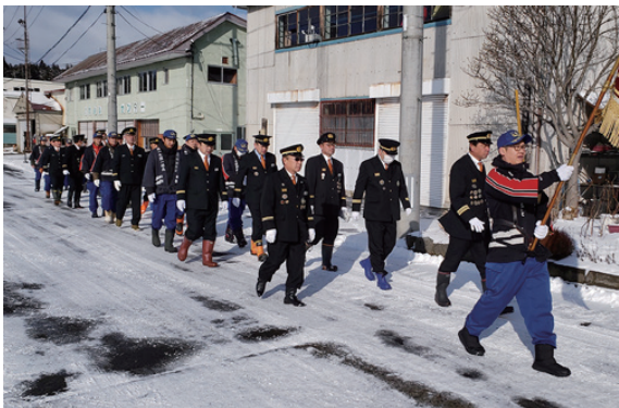
火災予防を呼びかけ分列行進する消防団員