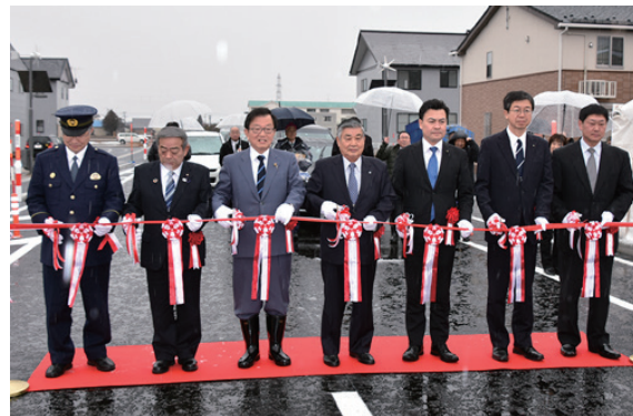
開通を祝いテープカットする関係者