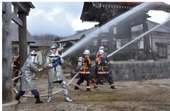
放水訓練を行う消防団員ら

訓練終了後、前後公町長が「今後とも地域ぐるみの訓練や予防消防の強化に励んでください」と講評を述べました。