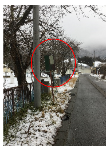
ふれあいセンター前