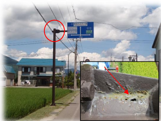
標識 横梁仕口溶接部上面の孔食