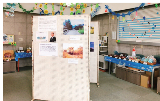
▲まちのえきまるしめ「沼尻軽便鉄道と猪苗代町の四季」

各会場に設置されたスタンプをすべて集めた人全員に沼尻軽便鉄道のペーパークラフト2種類を配布しています。配布場所は道の駅猪苗代内の観光案内所です。