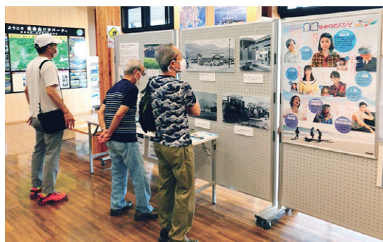
▲道の駅猪苗代「沼尻軽便鉄道と古関裕而」

現在放送中のNHKの連続テレビ小説(朝ドラ)「エール」のモデルとなった福島市出身の作曲家、古関裕而が作曲し、小野町出身の作詞家、丘灯至夫が作詞した「高原列車は行く」は、かつて猪苗代町内を走っていた沼尻軽便鉄道がモデルになっています。