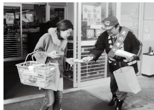
買い物客にチラシなどを手渡す消防団幹部

会津地方広域市町村圏整備組合消防本部と猪苗代消防署の街頭啓発活動は12月19日、町内のヨークベニマル猪苗代店とリオンドール猪苗代店で実施されました。活動には消防署員の他、町消防団幹部や町婦人消防隊から約20人が参加。買い物客に防火を呼び掛けるチラシやティッシュなどを配り、火災予防と住宅用火災警報器（以下 住警器）の早期設置を呼びかけました。