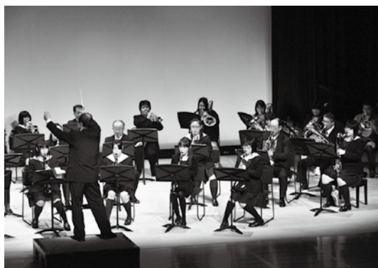
猪苗代吹奏楽団と猪苗代高校吹奏楽委員会の演奏

猪苗代吹奏楽団が主催する「東日本大震災復興支援音楽祭2011 いなわしろ音楽祭」は12月10日、学びいなで開かれました。同楽団の他、福島県ばんだい荘あおば、猪苗代中学校吹奏楽部、同校3年2組、猪苗代高校吹奏楽部、翁島・千里・吾妻幼稚園など町内の団体に加え、陸上自衛隊郡山駐屯地音楽隊、中野坂上ウインドオーケストラなども参加。吹奏楽はもちろん、太鼓や合唱などさまざまな音楽が観客の心を癒しました。