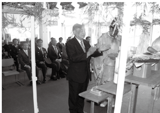
玉串をささげ、今シーズンの安全を祈願する前後町長

猪苗代スキー場の安全祈願祭は12月2日、同スキー場「I・S・K」で開催されました。祈願祭には町内の関係団体やスキー場関係者ら約50人が出席、玉串をささげ、シーズン中の無事故と盛況を願いました。