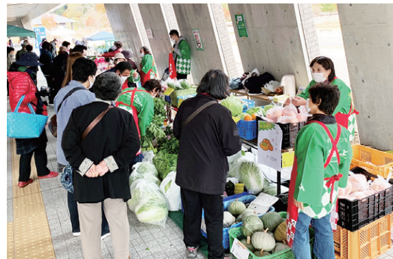
町内産の農産物が並ぶ物産展

農産物物産展には、町内産のハクサイやダイコン、キャベツなどのほか、ブランドそば粉の「いなわしろ天の香」の新そば粉が販売され、大勢の買い物客でにぎわいました。