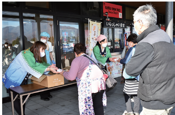
初日に行われた紅白饅頭の振る舞い

11月19日に開業4周年を迎えた「道の駅猪苗代4周年記念感謝祭」は11月19日から22日まで、同所で行われました。感謝祭では、先着順で紅白まんじゅうや甘酒、いなわしろ天のつぶなどの振る舞いが行われたほか、道の駅猪苗代ならではの商品が当たる抽選会が行われました。また、最終日には、現代版組踊「息吹」によるダンスパフォーマンスが披露されました。道の駅猪苗代には開業以来の4年間で約360万人が訪れています。