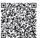
町ホームページ QRコード