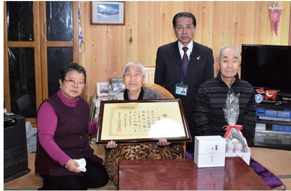
賀寿などを受けたヨシミさん(左から2人目)