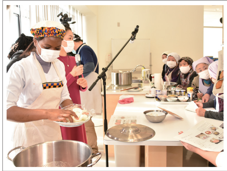
ガーナ料理を作るビューティーさん(左)