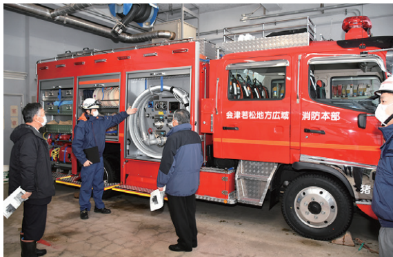
猪苗代消防署に新たに配備された水槽付き消防ポンプ車

猪苗代消防署の水槽付き消防ポンプ車お披露目式は12月16日、同署で行われました。老朽化に伴う更新によるもので、新たに配備された車両には薬剤と水を混ぜ合わせて同時に放水できる薬剤混合装置を装備。薬剤を混合した水溶液を使用することで水のみでの放水よりも燃焼物に水が浸透しやすくなり、従来より少ない放水での消火が可能になっています。また、車両には10本のホースを収納できるホースカーなどが備えられています。