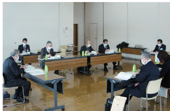
指定管理者の候補者を点検評価する委員ら