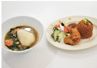
オクラスープ(左)とジョロフライス(右)。 ニンニクやショウガ、唐辛子などが入り、 本場独特の香りが漂う

東京オリンピック・パラリンピックで共生社会ホストタウンに登録されている町では12月18日、学びいなかガーナ創作料理講習会を開きました。町民の皆さんにガーナの伝統的な料理方法を学んでもらい、本場の味に親しんでもらおうと企画されました。 講習会には、フランク・オチエレガーナ駐日大使らが訪れたほか、ガーナ大使館のビューティー・アヘッド・アブラ大使専属料理人が講師を務め、町民約20人が参加しました。ビューティーさんは、ガーナやナイジェリアなど西アフリカで人気の「オクラスープ」とガーナ料理の基礎となるトマトソースを使った「ジョロフライス」の作り方を紹介しました。 参加者は、真剣な表情でメモを取るなどして、ガーナ料理の調理方法を学びました。