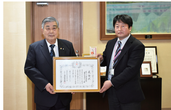
前後町長から感謝状の伝達を受けた土屋支店長(右)