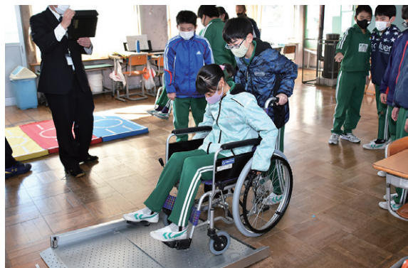
車いす体験を行う翁島小学校の児童