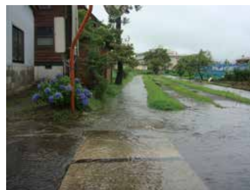
千里地区の水害状況

【質問】定数より職員が少くないなら、町民の満足度を得るため、経験を多く積み知識や見識を持つ、意欲ある退職職員等の再任用制度を活用すべきでは。 【総務課長】質問を真摯に受け止め、機会があれば検討し、再任用の制度を有効に活用して対応したい。