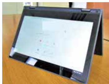
小中学校で使用するタブレット

問 国の「GIGAスクール構想」は小学校1年生からとなっている。国と町の方針にズレがあるが。 答 町では対象を小学校5年生から中学校3年生までと方針を固め進めてきたが、計画期間の令和5年度までに全児童生徒にタブレット端末を貸与し、学力向上につなげるよう、計画の見直しを行った。