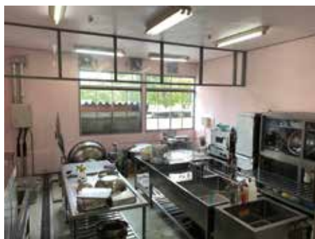
学校の給食調理室

【教育総務課長】主食はすべて町外へ委託し、町内小中学校で米飯約750万円、パン約160万円、麺約147万円で、合計約1056万円となっている。