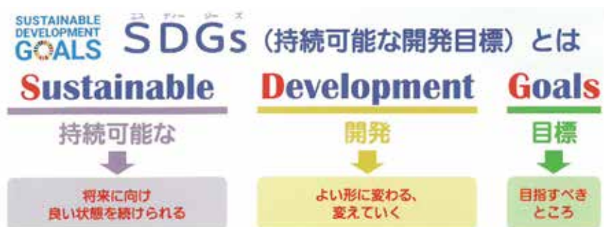
配布されたパンフレットにSDGsの説明が記載されている

【質問】36行政区の自主防災組織が防災訓練・避難訓練を実施する際には、町が協力できる部分は積極的に取り組みたい。