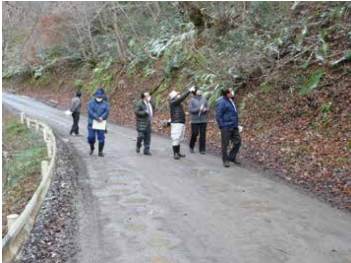
林道達沢不動滝線の審査をする経済建設常任委員

観光による通行車両の増加に伴い、道路損傷が激しく、高齢化により地区での維持管理が困難なため、道路の維持管理及び観光スポットとしての整備をお願いしたい。