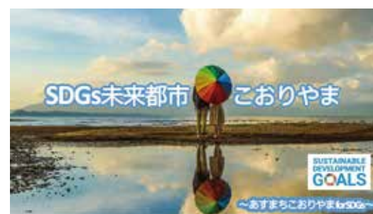
SDGs「未来都市こおりやま」

【質問】磐梯山エリアスキー場の未来に必要なスキーリゾートふくしま創造会議の取り組みは。