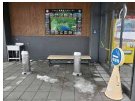
屋外に設置された道の駅猪苗代の喫煙所

Q. 健康増進法による役場庁舎の分煙環境整備は A. 平成23年10月から敷地内全面禁煙とした