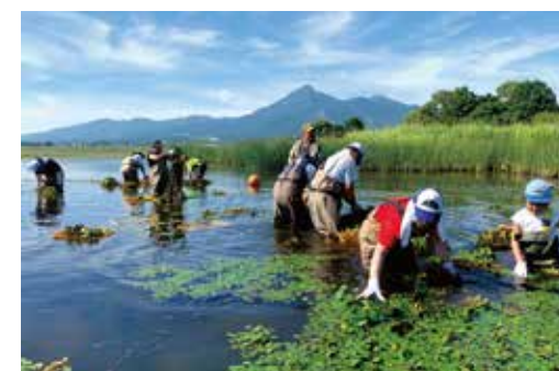
子ども達との繁茂ヒシ刈り取り

【上下水道課長】町内業者には、年1回の法定検査を受けなければならない浄化槽法第11条の検査補助員がいないため、保守点検・清掃の一括契約が出来ない。検査補助員の育成も検討していきたい。