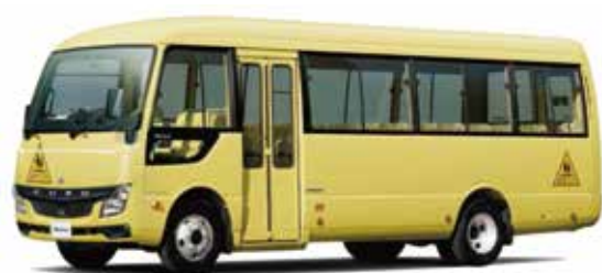
こども園に配置予定のマイクロバス