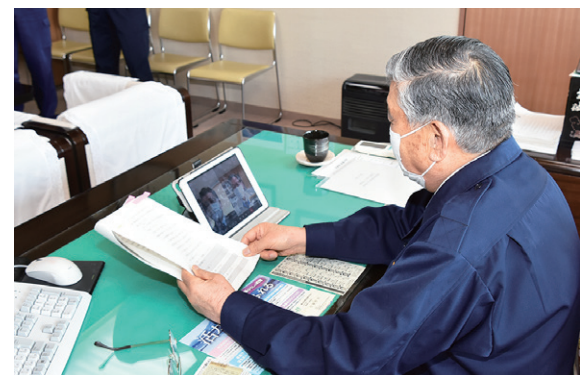
ウェブ会議システムで対応を協議する前後町長

猪苗代、磐梯、北塩原の3町村でつくる磐梯山火山防災連絡会の情報受伝達訓練は2月22日、各町村役場で行われました。訓練では、磐梯山で火山性微動などが発生し、仙台管区气象台から噴火警報が発表され、噴火警戒レベルが2に引き上げられることを想定して実施されました。連絡を受けた各町村長は、ウェブ会議システムを使って登山道の閉鎖や入山者・スキー客などの安全確保、正確な情報発信の方法などを協議しました。