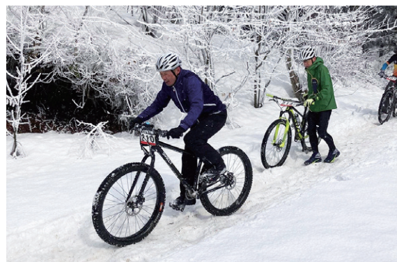
雪上をマウンテンバイクで駆け抜ける参加者