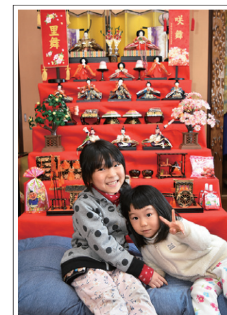
【撮影日】 2月26日 【撮影場所】 扇田