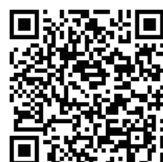
専用サイト NHK聖火リレー

また、聖火リレーの様子は NHK 聖火リレー専用サイトで中継されますのでぜひご覧ください。