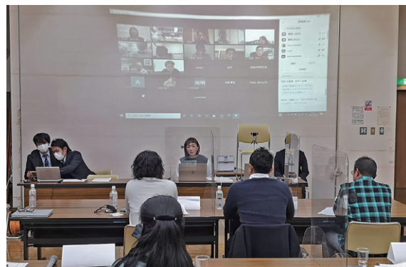
オンライン交流会の様子