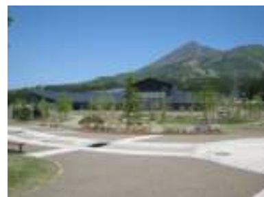
体験交流館「学びいな」