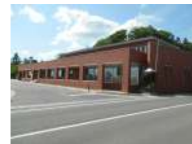
図書歴史情報館「和みいな」