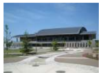
総合体育館「カメリーナ」