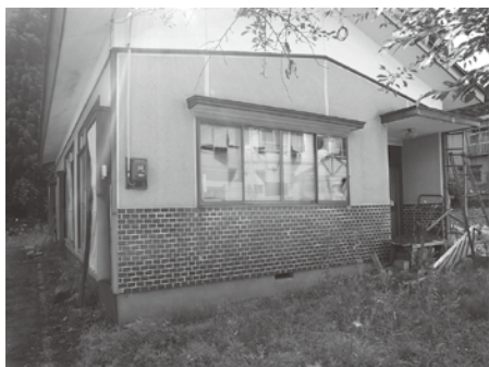
景観・保安・生活環境への影響は

【質問】過去と比較した出生数の現況は。 【企画財務課長】十年前の平成23年が111人。令和元年が62人。令和2年が52人と、ここ2年間は大幅減少している。 【質問】平成26年に示された人口ビジョンの推計値・目標値に対する現況は。 【企画財務課長】令和2年9月現在の人口は1万3524人。推計値に対し178人減、目標値に対し243人減となっている。 【質問】まち・ひと・しごと創生会議において、出生数減少や人口減少抑制についての議論は。 【企画財務課長】六つの重点プロジェクトを設け進捗の管理、施策事業の検証を行っている。人口ビジョンや総合戦略事業に対する評価・提案をいただき進めている。