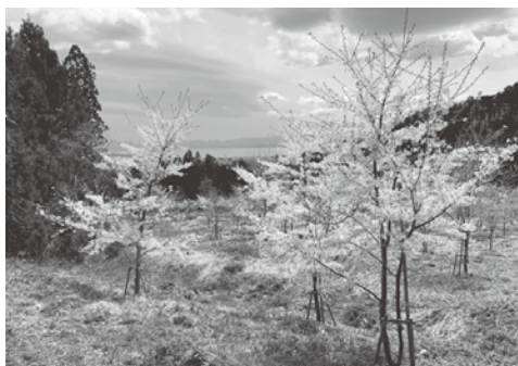
人知れず咲く桜たち。琵琶沢原森林公園

【農林課長】大規模な苗木の配布は終了しているが、民間企業からの寄付を受ける形で植樹を実施。現在、町全体で7465本が植樹されている。 【質問】琵琶沢原森林公園に企業から寄贈された千本の桜が人知れず咲いているが、これからのプランは。 【農林課長】ベンチや見晴台、遊歩道を整備して、公園と一体化した利用を図りたい。