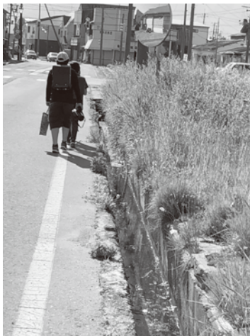
通学路の歩道整備を

Q. 地域からの声をどのように受け止め取り組んでいるのか A. 現地確認のうえ危険性や重要度が高い場所を整備対応