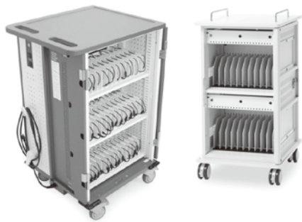
タブレット端末充電保管庫