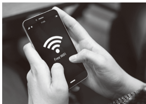
Wi-Fi導入で訪日外国人の集客力向上

【質問】ガーナからのホストタウン受け入れ選手のスケジュールは。 【生涯学習課長】オリンピック選手は7月上旬から3週間ほど、パラリンピック選手は8月上旬から3週間ほど滞在する予定。 【質問】コロナ対策は、入国後4日は宿泊所内での隔離、毎日の抗原検査が義務付けられる。 【質問】コロナ対策後の町の方々との交流は。 【生涯学習課長】滞在14日間後から小学生との陸上関係やガーナ風料理の給食での交流を考えている。 【質問】インバウンド対策として観光庁が勧めている免税店の設置への考えは。