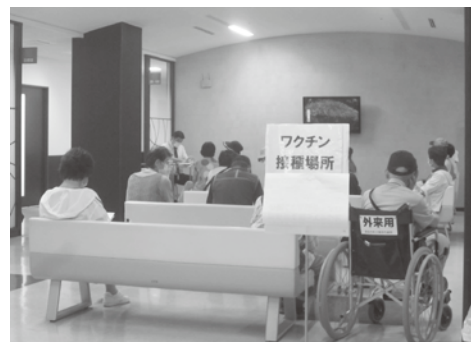
ワクチン接種会場

【保健福祉課長】6月4日現在においては、昭和27年4月1日生まれの方まで接種券を発送しておりそれ以後に生まれた方へも順次発送して