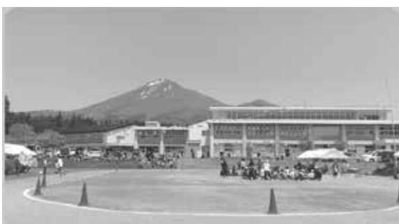
町内にある県立支援学校

【保健福祉課長】障がいの有無にかかわらず、誰もが住み慣れた地域で安全で安心して生活し、共に支えあって暮らす共生社会である。