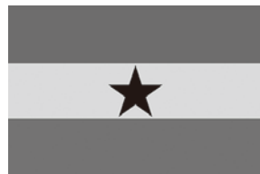
「ガーナ共和国」の国旗

Q. オリンピック開催後のガーナ選手との交流は A. 開催後に陸上選手と子どもたちの交流を予定している