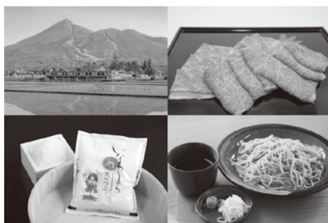
地域の特色ある返礼品

ふるさと納税の進捗状況については、ホームページを分かりやすく改善しているが、寄付金額は元年度とほぼ同額となった。また、返礼品については、魅力ある返礼品に順次変えていく。