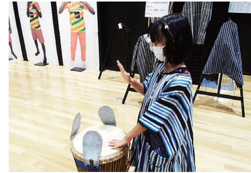
民族衣装を试着して「ジャンベ」を叩く来場者