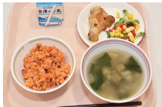
給食で提供されたガーナ風の献立