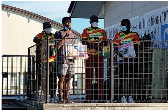
お礼の言葉を述べるジャクソン選手(左から2人目)