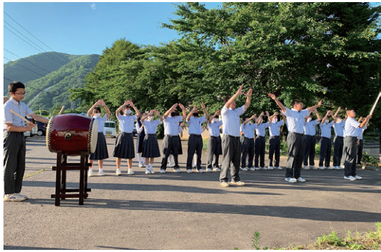
ガーナ選手にエールを送る吾妻中の生徒