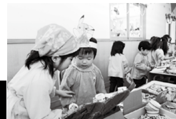
写真上 「これくださーい」笑顔で楽しそうに買い物をする子どもたち 写真下 「お土産どうしよう」「これなんかいいんじゃない」そんな会話が聞こえてきそうな2人