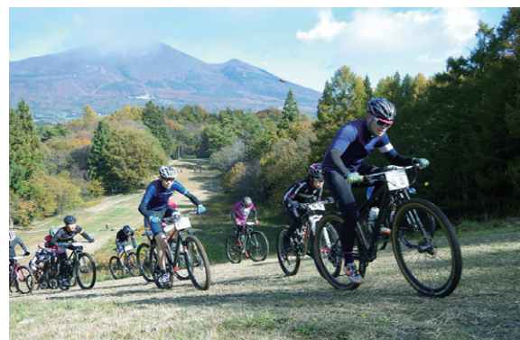
白熱したレースを繰り広げる参加者