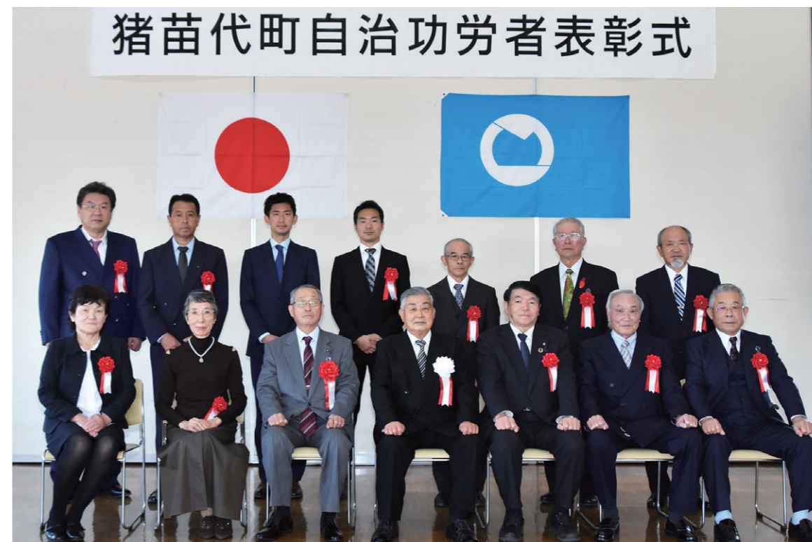
表彰式に出席した受賞者ら

令和3年度町自治功労者表彰式は11月3日、町役場で行われました。表彰式には、受賞者をはじめ、町、町議会、関係機関・団体の来賓など約40人が出席しました。