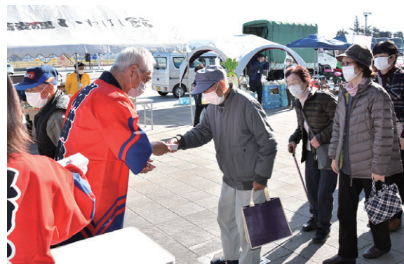
開業5周年を祝う紅白まんじゅうを受け取る来場者