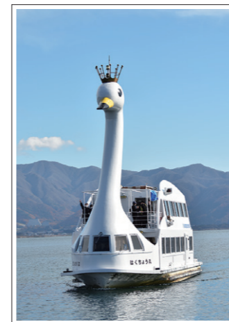
【撮影日】 11月12日 【撮影場所】 猪苗代湖・長浜

新会社の下、10月29日から約1年半ぶりに運航を再開した猪苗代湖の遊覧船「はくちょう丸」です。今月には「かめ丸」も運航再開を予定しています。