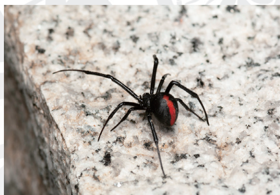
セアカゴケグモ