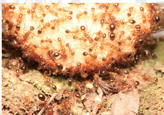
魚肉ソーセージに集まるヒアリ（一財）自然環境研究センター

今回の企画展では、カヤノミ、ダニなどの聞きなじみのあるムシたちや、近年話題となったヒアリやセアカゴケグモなど、さまざまな毒虫たちを生体展示や標本展示にて紹介します。